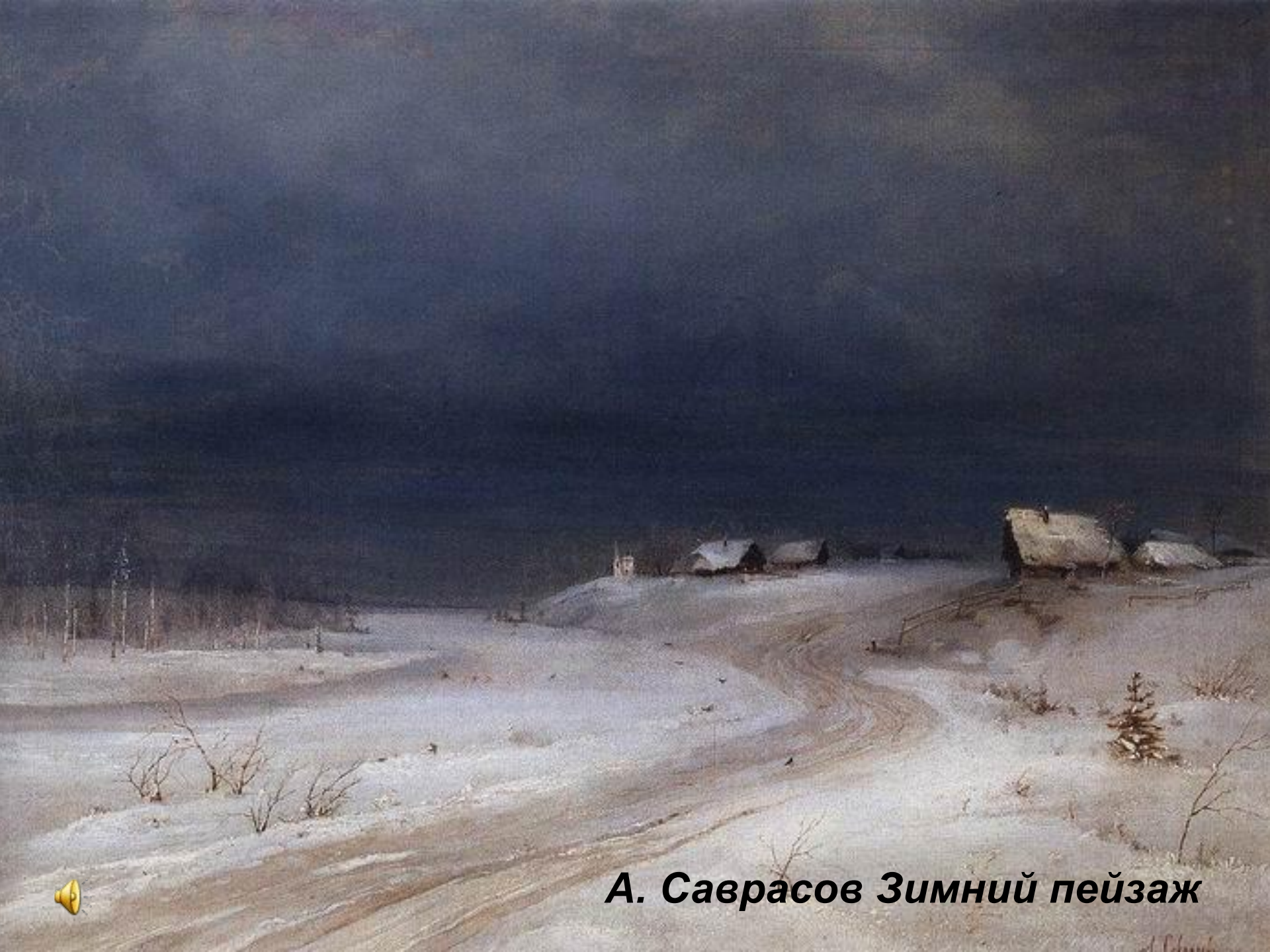
А. Саврасов Зимний пейзаж