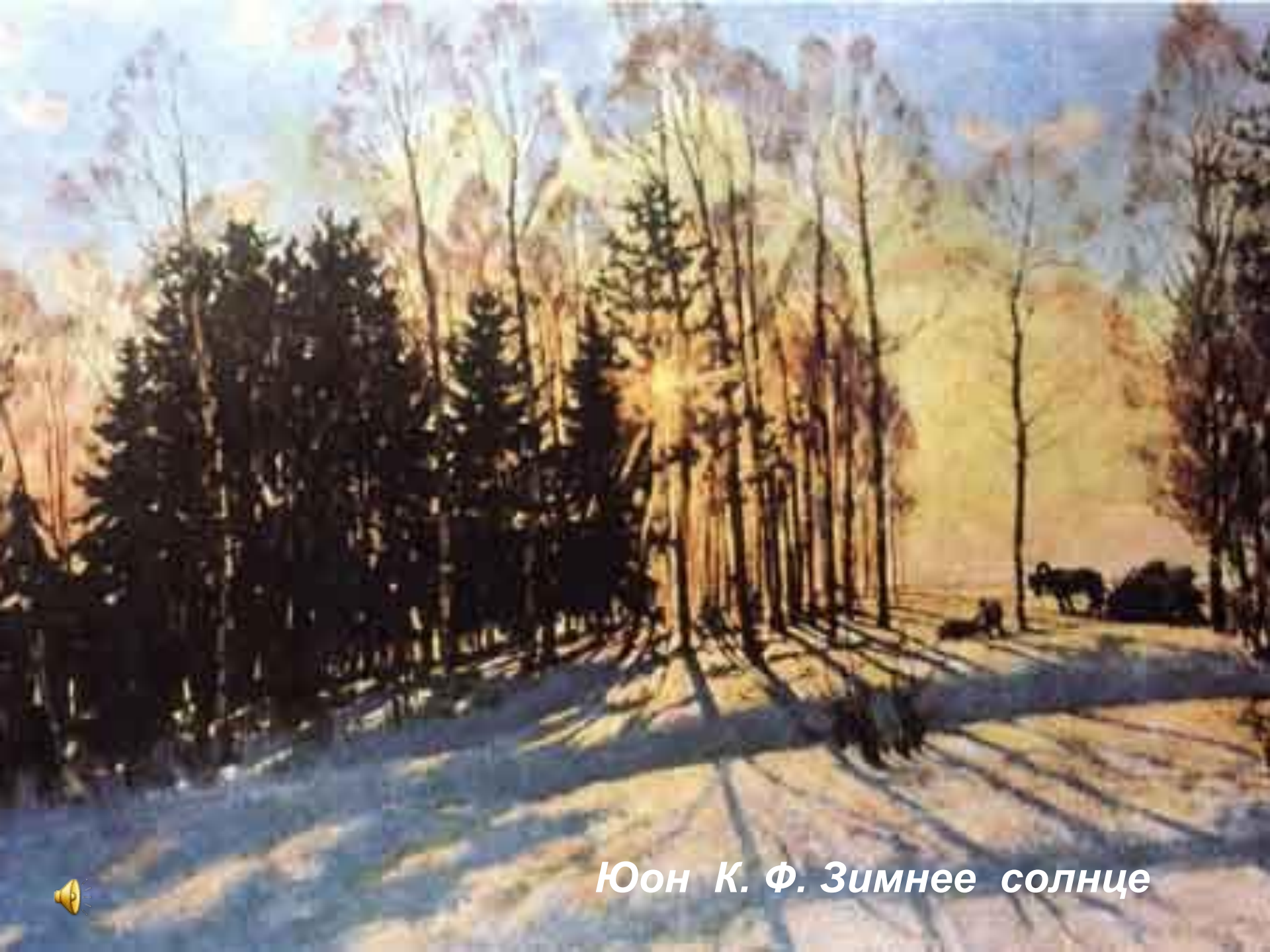
Юон К. Ф. Зимнее солнце