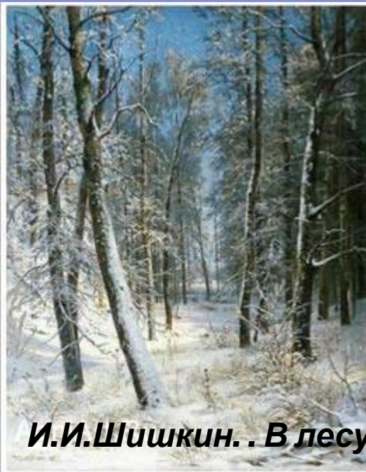
И.И.Шишкин. . В лесу