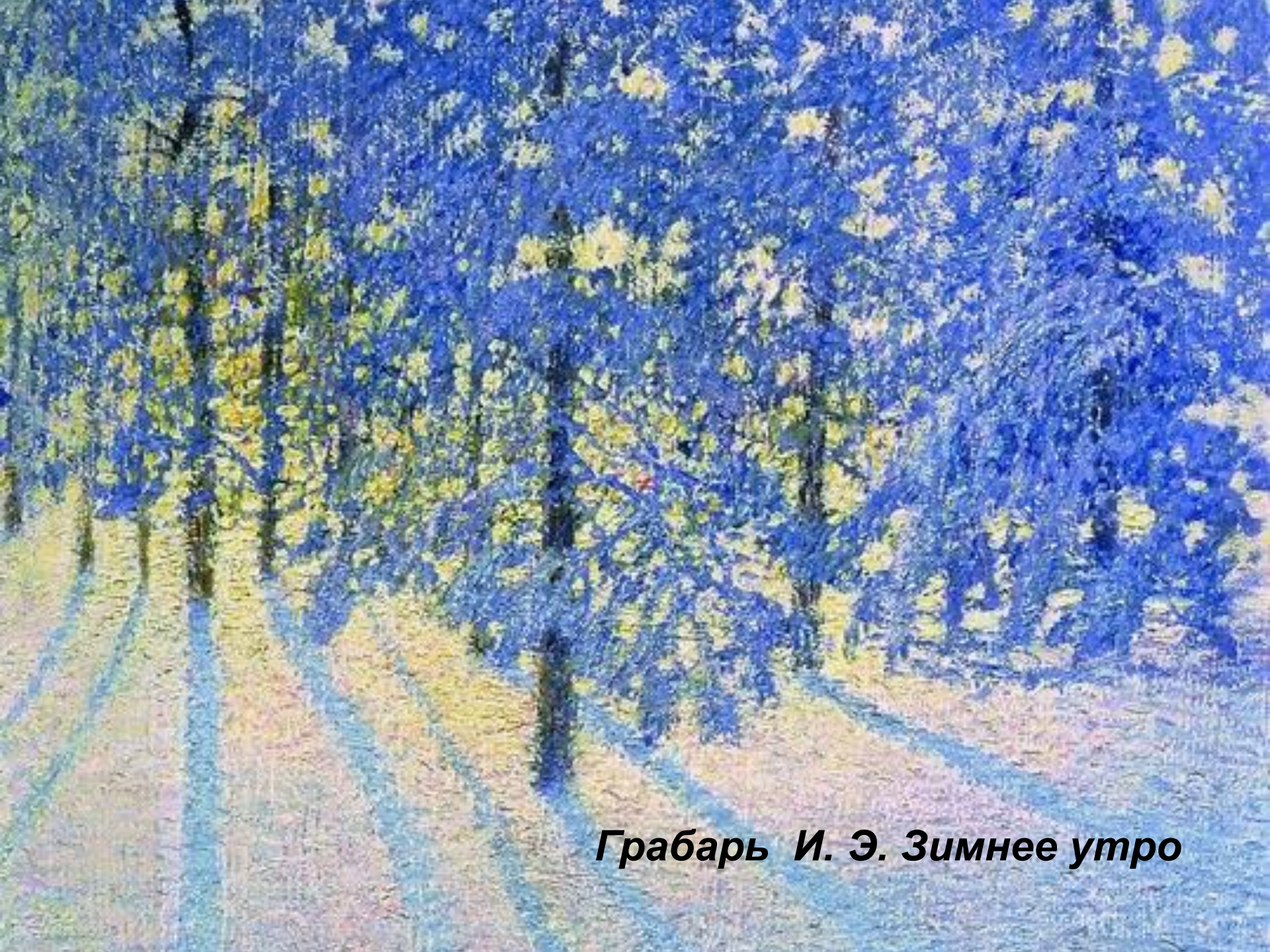
Грабарь И. Э. Зимнее утро