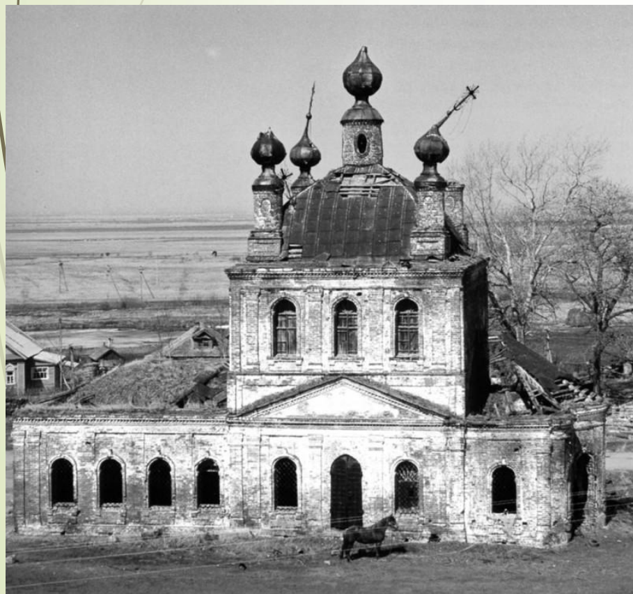
Село Васильково. Ильинский храм (1808 г.)

Кто-то живёт и не задумывается о своём духовном мире, не ходит в церковь, не соблюдает заповеди Христовы, не верит в Бога.