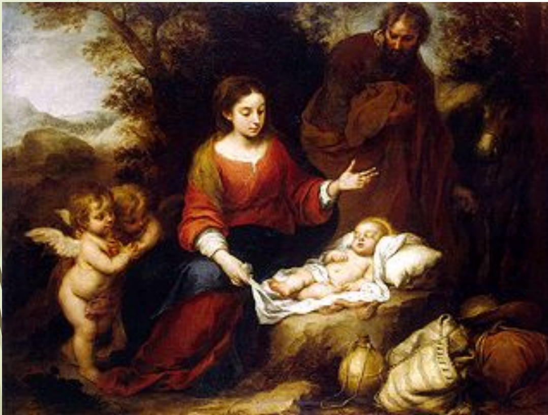
Мурильо. "Дева Мария"