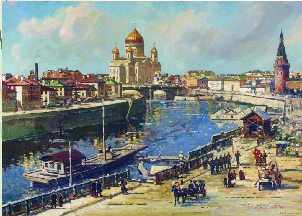
Евстигнеев Алексей Витальевич - Вид на Храм Христа Спасителя. 1994