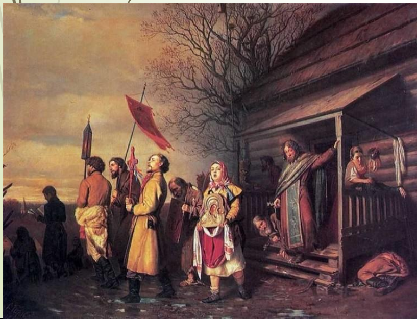
Василий Перов. "Сельский крестный ход на Пасхе". 1861 г.

Благодаря православному церковному календарю мы узнаём даты всех православных праздников, а это значит, что в этот день желательно сходить в церковь, прочитать молитвы, раздать милостыню, помочь больным и нуждающимся. А в дни почитания икон и святых - прочитать акафист.