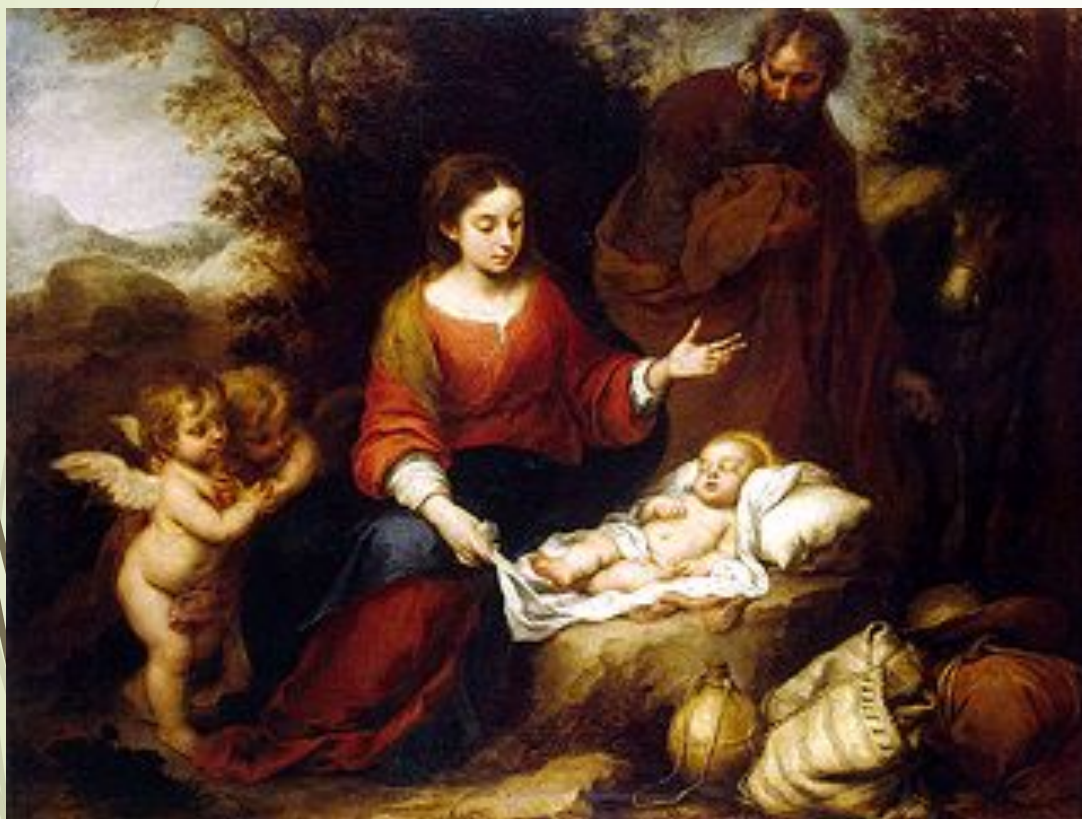
Мурильо. "Дева Мария"