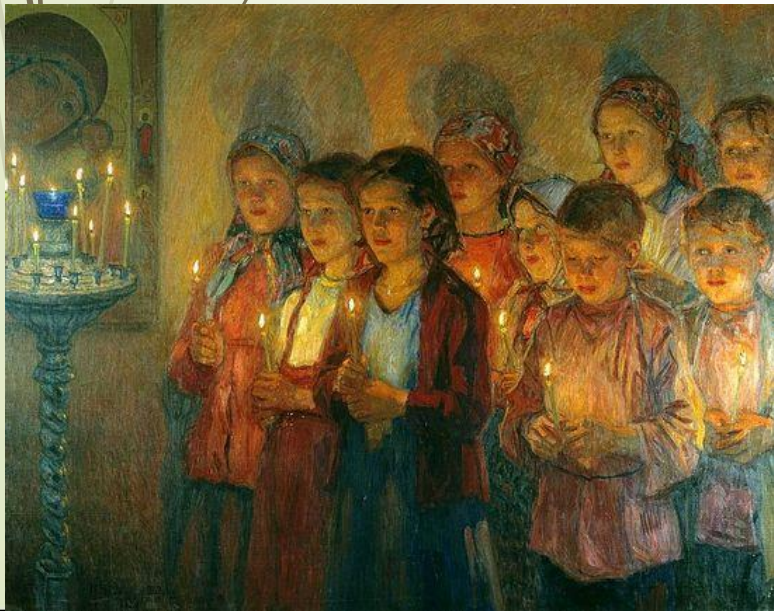
Н.П. Богданов- Бельский. В церкви. 1939

А кто-то очень внимательно относится к своему духовному миру, постоянно обогащает себя духовно: ходит в церковь, читает молитвы, соблюдает посты, знает и чтит все православные праздники, очищает себя духовно от всего скверного.