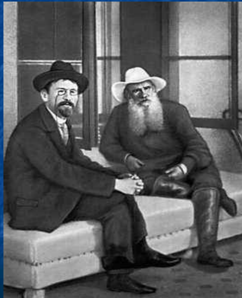
Толстой и Чехов в Крыму