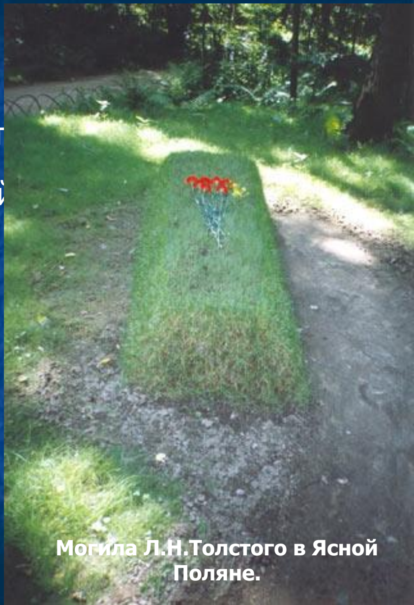
Могила Л.Н.Толстого в Ясной Поляне.