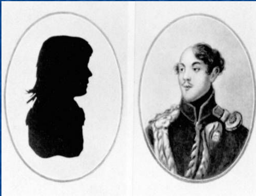
Родители Льва Толстого