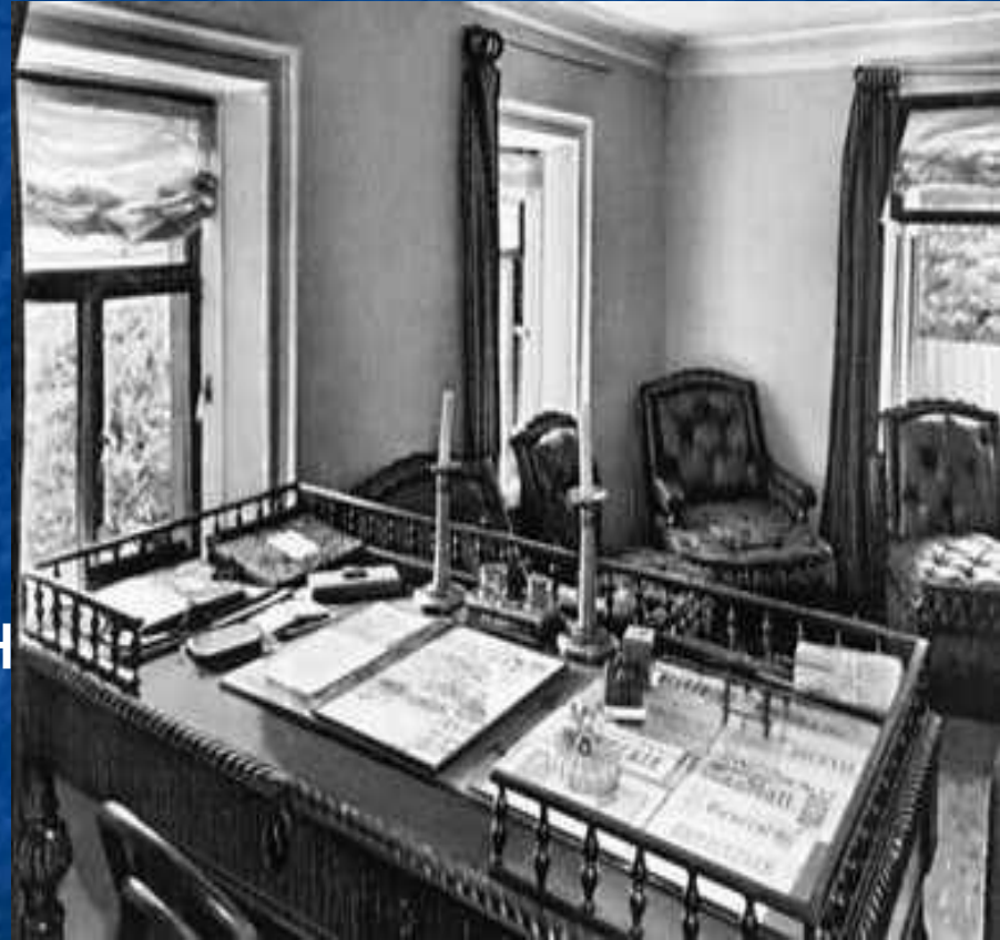
Рабочий кабинет Л.Н.Толстого в Ясной Поляне