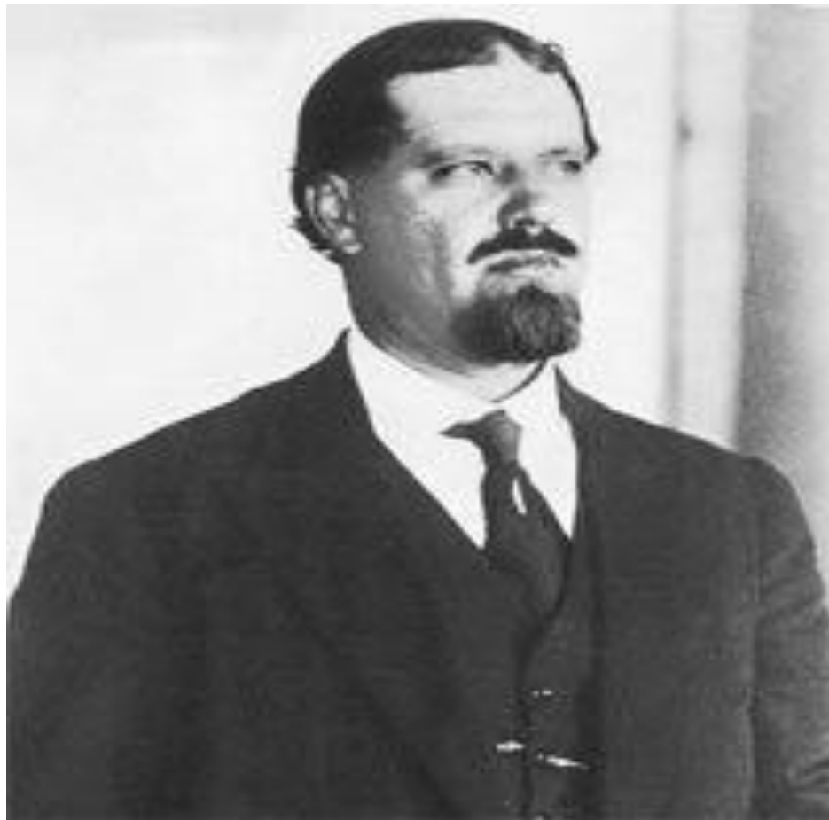
Петр Петрович Кончаловский