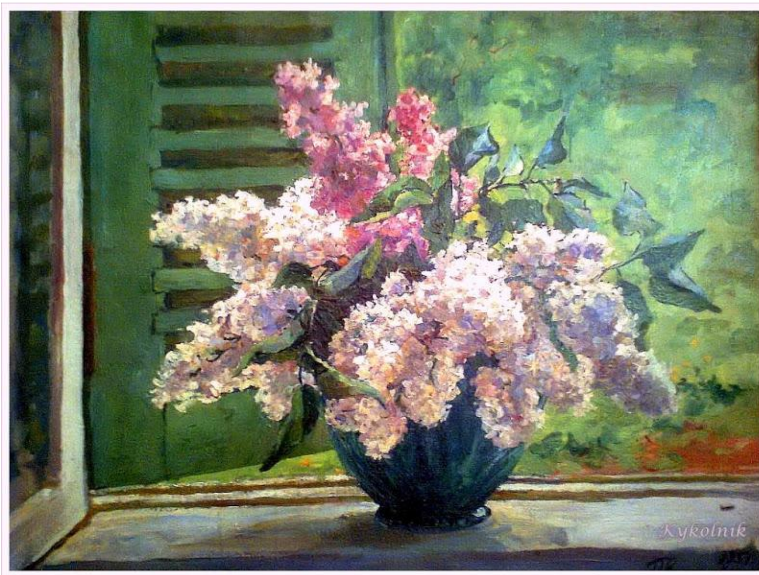
«Сирень на фоне ставни» 1955