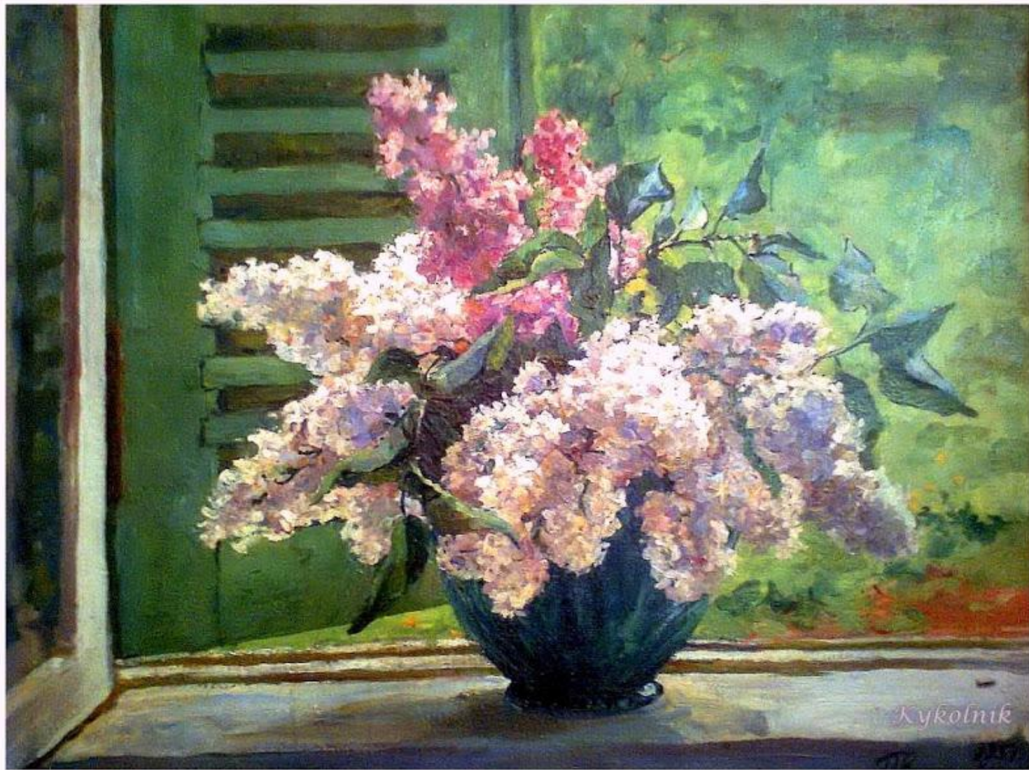
«Сирень на фоне ставни» 1955