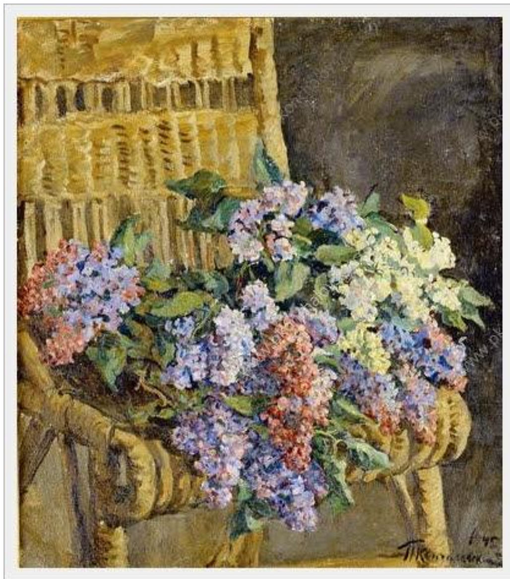
«Сирень на плетеном стуле» 1945