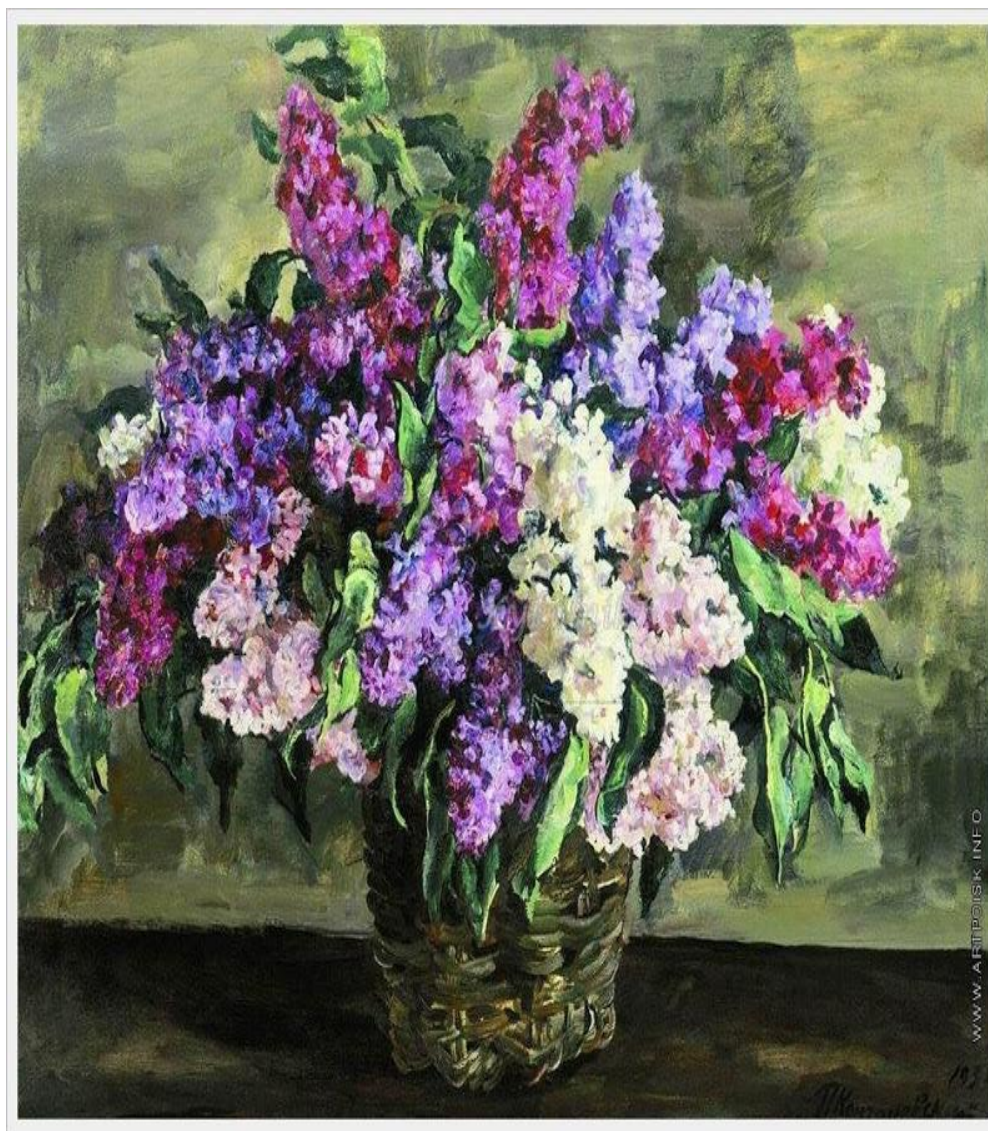
Сирень в корзине ("героическая")» 1933