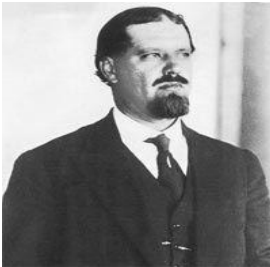
Петр Петрович Кончаловский