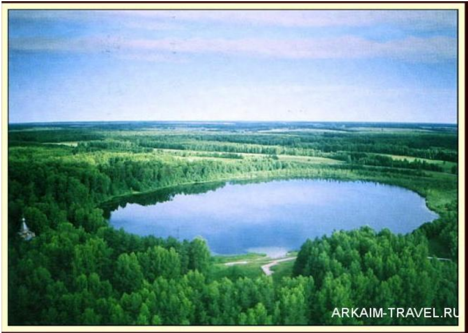
Нижний Новгород, Хохлома (г. Семёнов), озеро