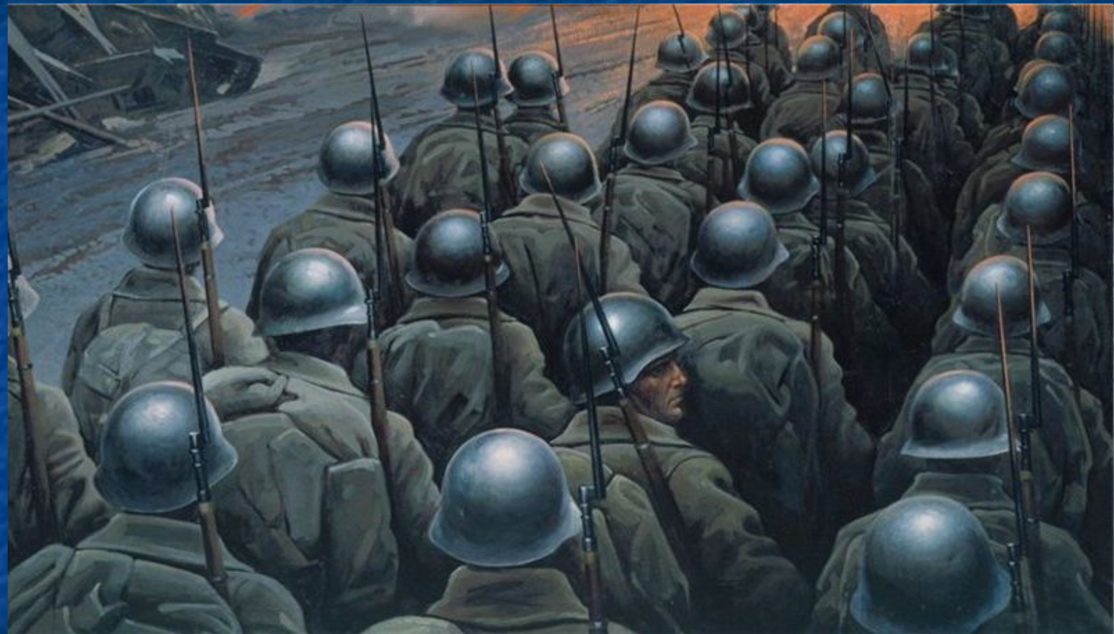
К.А. Васильев «Тоска по Родине»