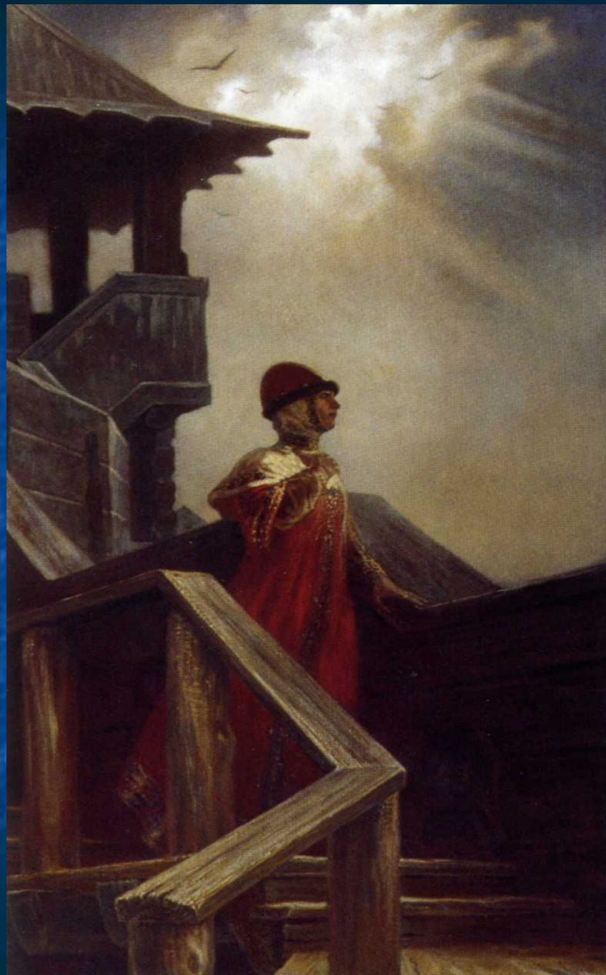
Б.М. Ольшанский «Плач Ярославны»