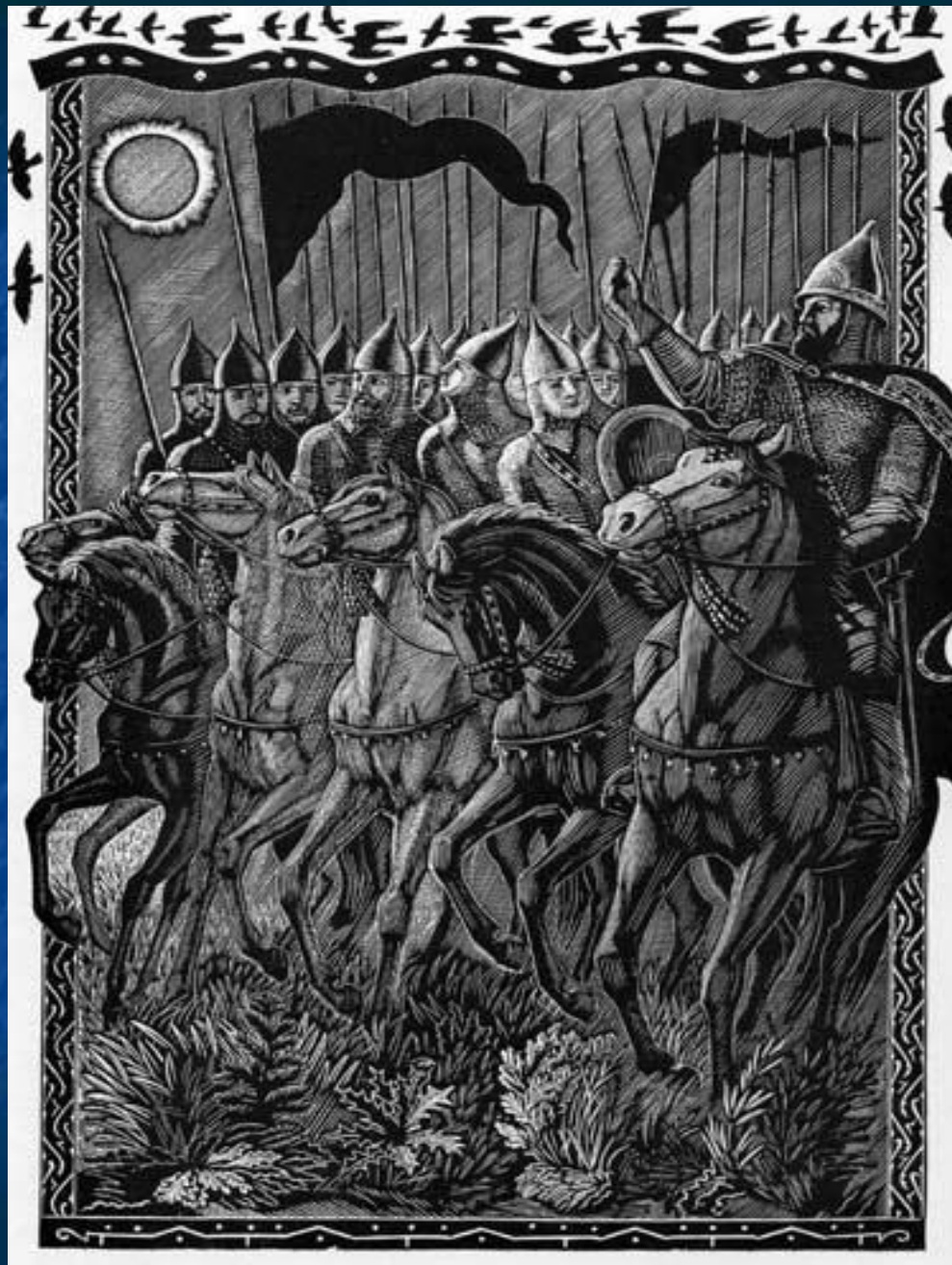
Гравюры В.А. Фаворского к «Слову о полку Игореве»