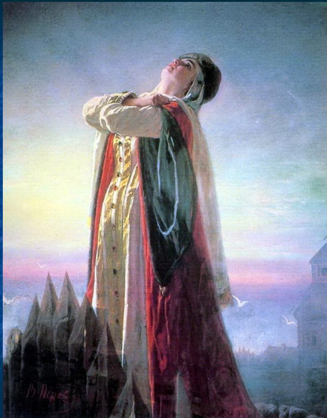
В.Г. Перов «Плач Ярославны»