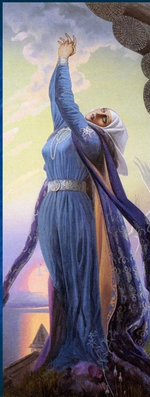
К.А. Васильев «Плач Ярославны»