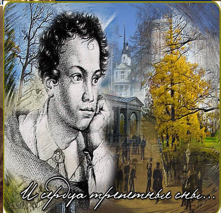
И сердца трепетные стны...