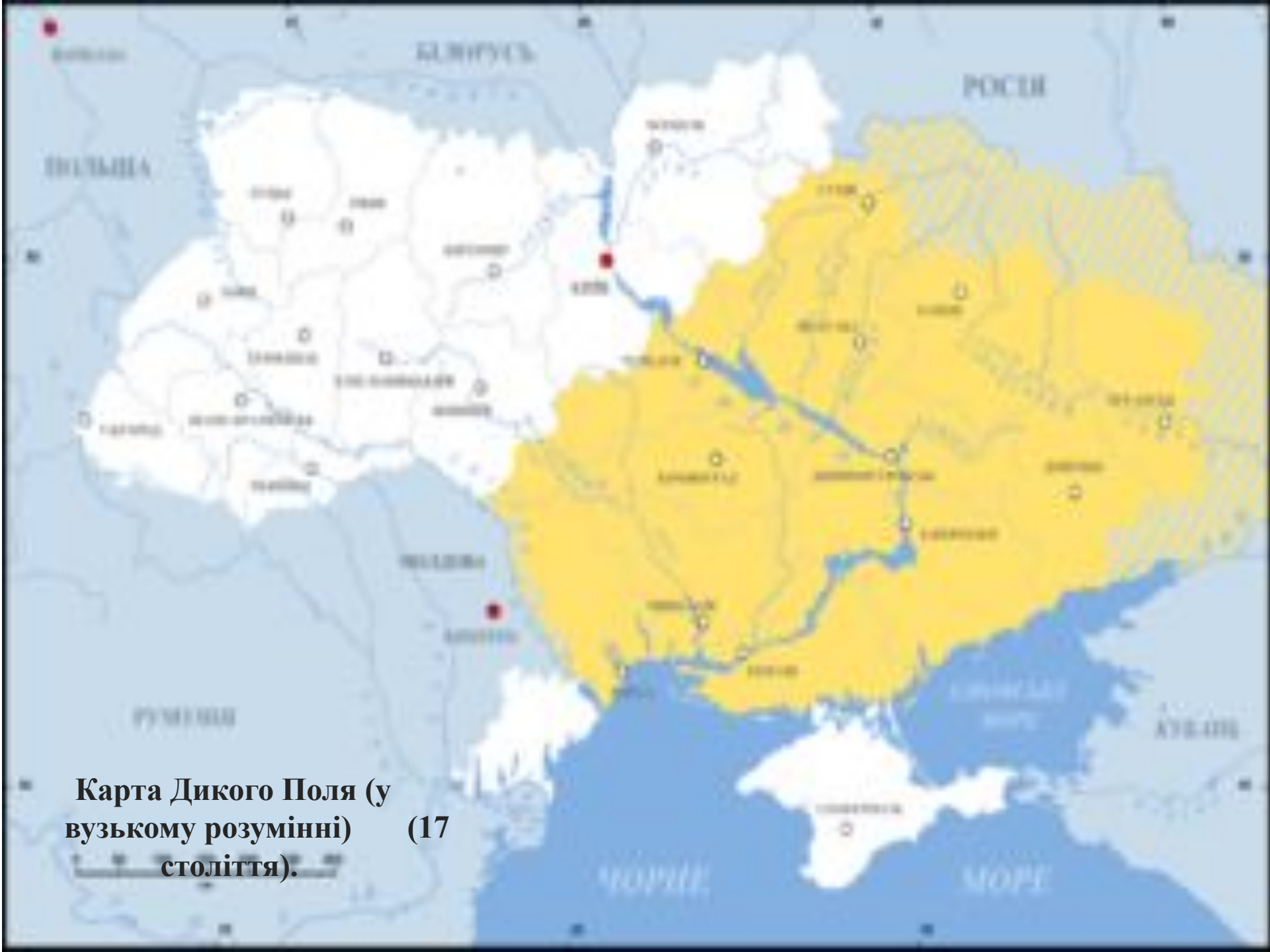
Карта Дикого Поля (у вузькому розумінні) (17 століття).