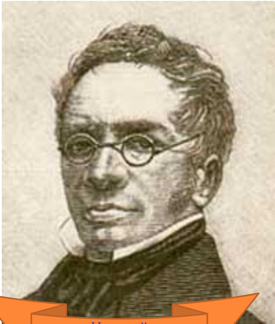
Николай Иванович Греч (1787-1867)

«ГЛАГОЛ ПРИДАЕТ РЕЧИ ЖИЗНЬ,- ПРИСУТСТВИЕМ СВОИМ ЖИВОТВОРИТ ОТДЕЛЬНЫЕ СЛОВА»