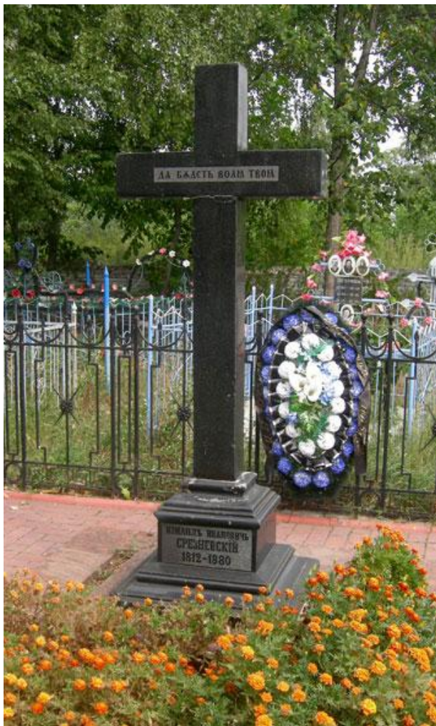
Могила И.И. Срезневского в Срезневе