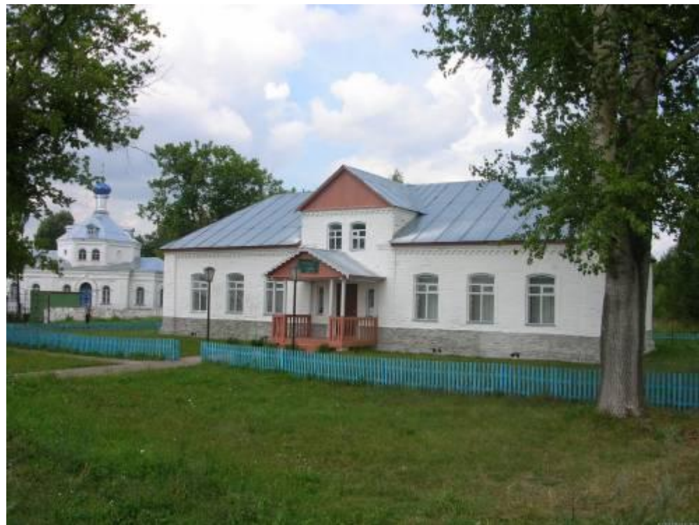
музей им.Срезневского в Срезневе