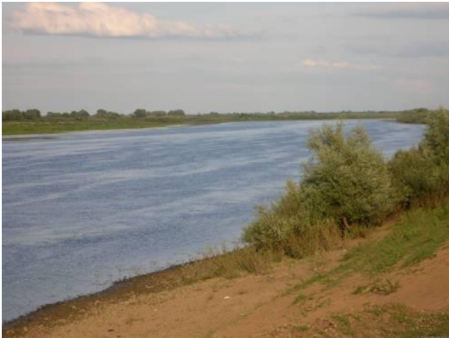
Берег реки Оки в селе Срезнево