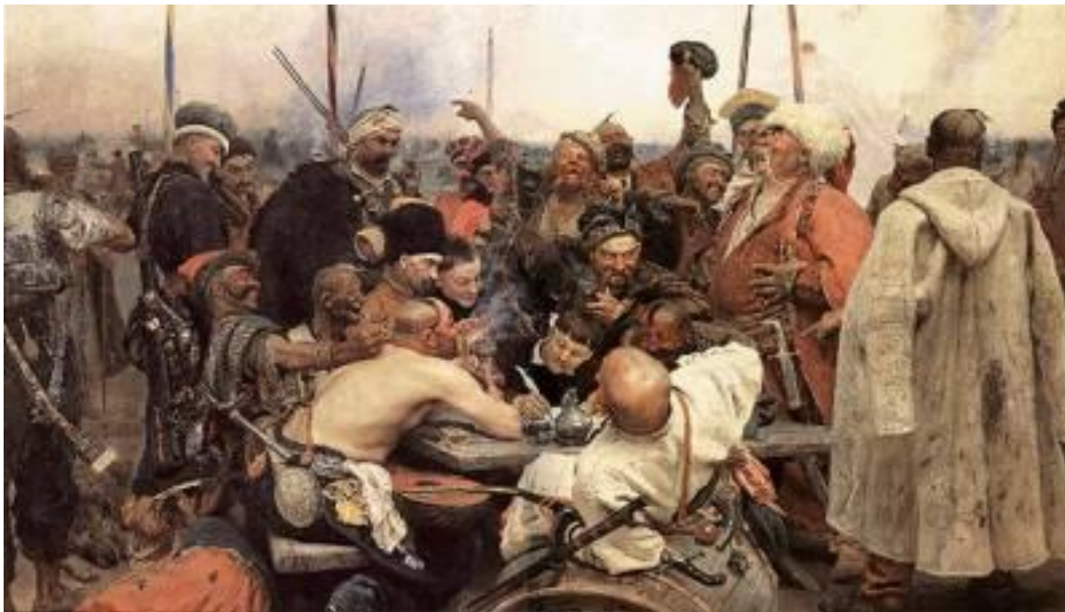
И.Е.Репин «Запорожцы пишут письмо турецкому султану»