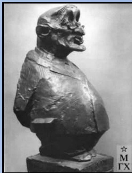
И.Грабарь. Дружеский шарж. 1962