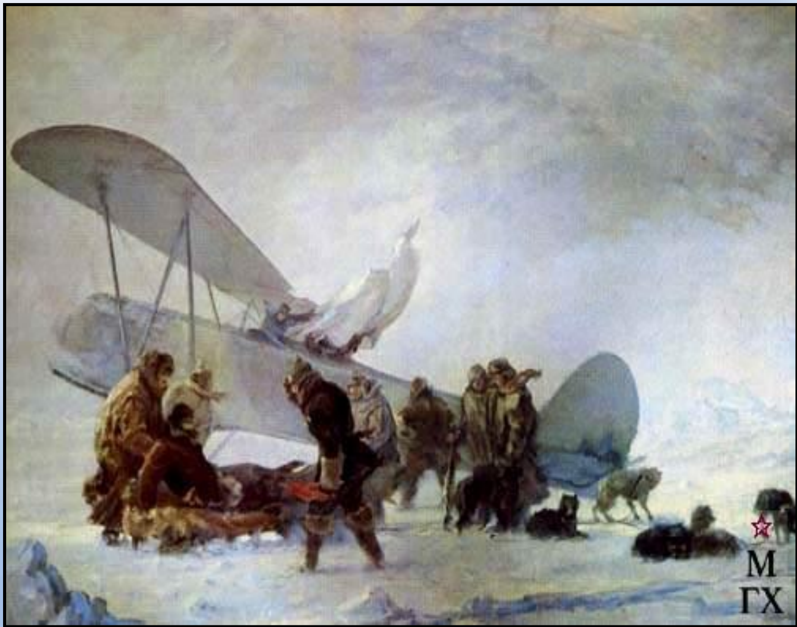
Больной О.Ю. Шмидт покидает лагерь челюскинцев. 1934