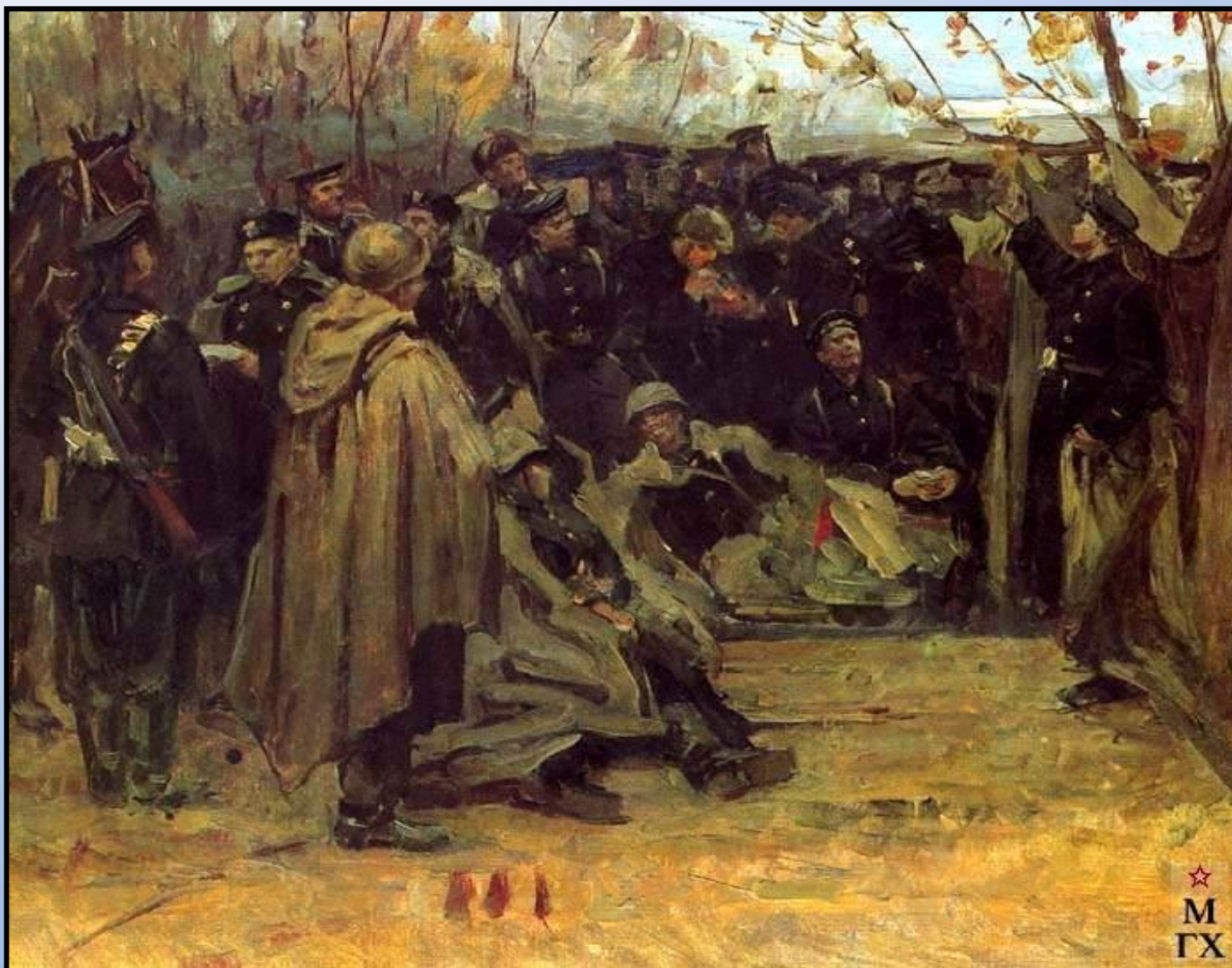
В отряде морской пехоты. Севастополь 1942 года. 1942