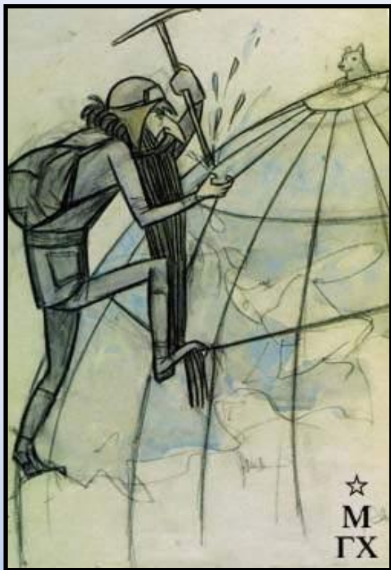
О.Ю. Шмидт на подступах к Северному полюсу. Дружеский шарж. 1934