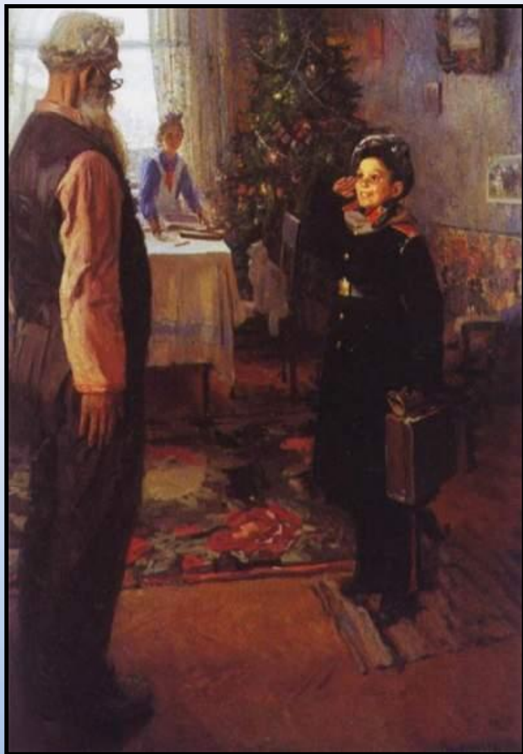
«Прибыл на каникулы» 1948