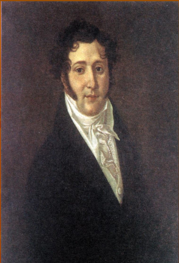
Юрий Петрович Лермонтов (1787–1831 гг.)