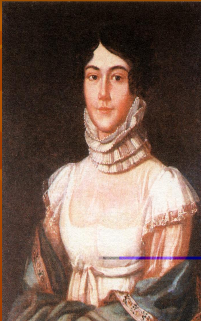
Марья Михайловна Лермонтова (1795–1817 гг.)