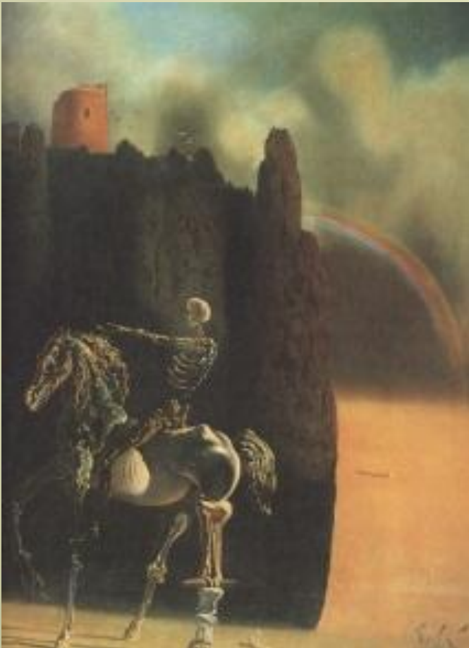
С. Дали «Всадник по имени Смерть»

СЮРРЕАЛИЗМ - литературное и художественное течение начала 20 века, для него характерна алогичность образов и нестандартное мышление.