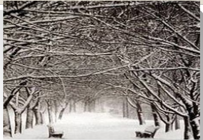
Қыс, зима, winter