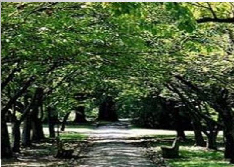
Көктем, весна, spring