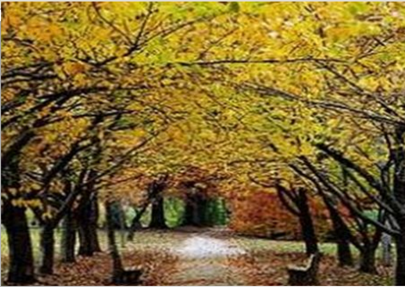
Күз, осень, autumn