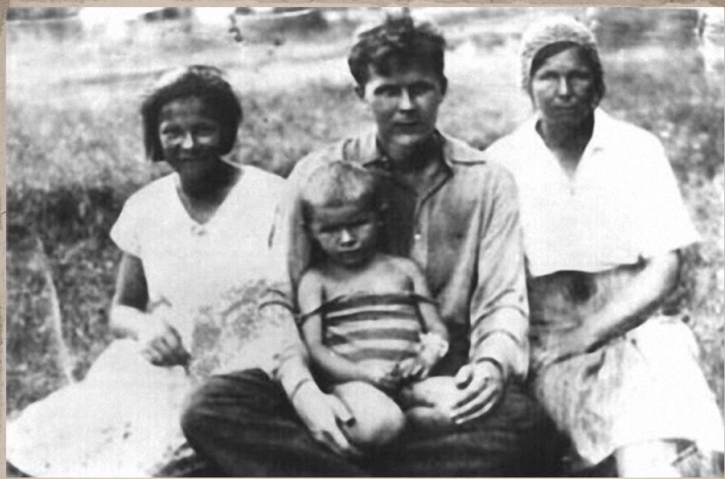
А.Т.Твардовский, мать, сестра и дочь