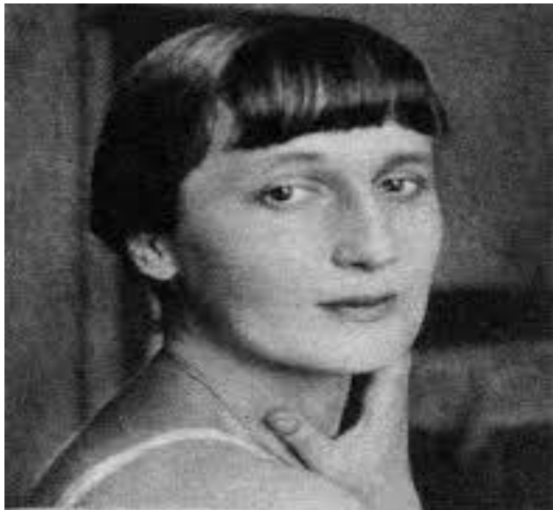
16 quibpaer 1946. M oca' Tane - Annyuka.