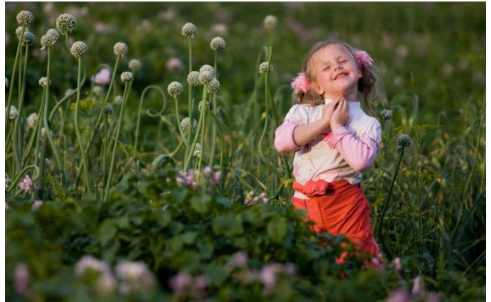
С. А. Есенин