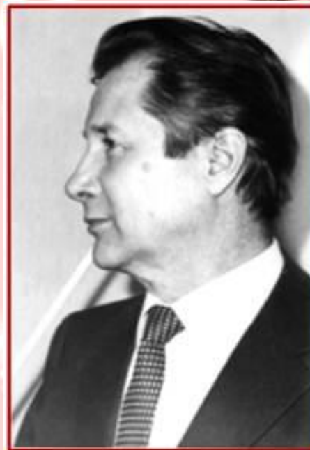
Композитор А.Я. Эшпай