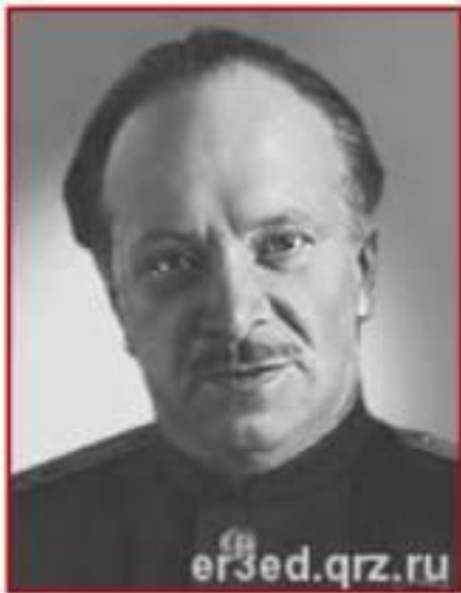
Поэт В.И. Лебедев-Кумач