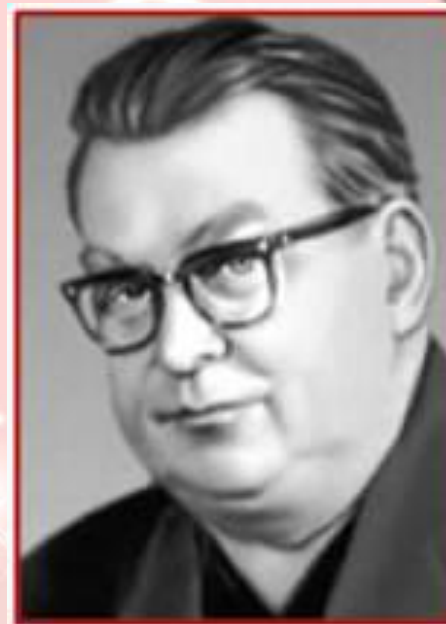
Композитор В.П. Соловьёв-Седой