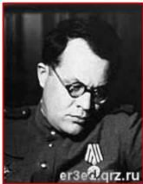
Поэт М.Л. Матусовский