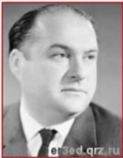
Поэт Е.М. Винокуров