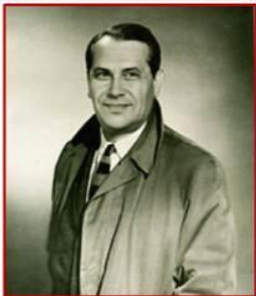
Марк Бернес, один из первых исполнителей песни