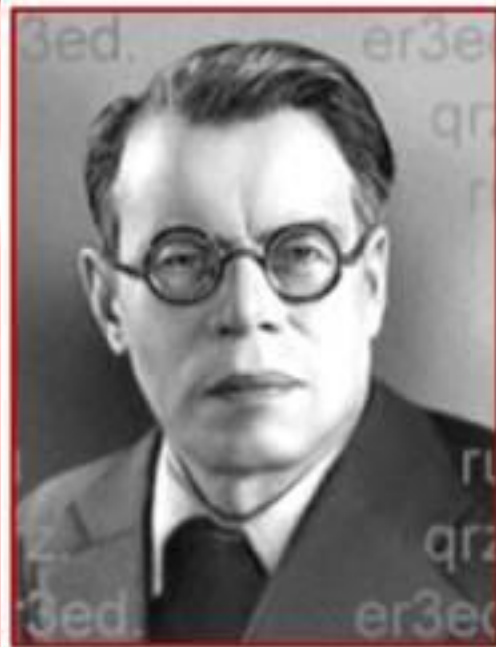
Поэт М.В. Исаковский