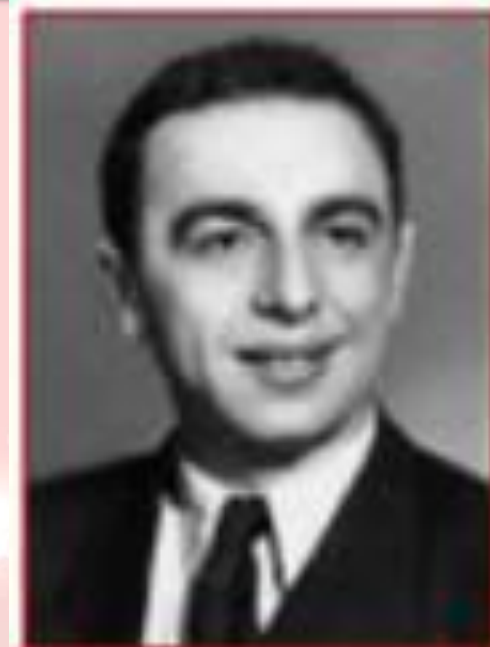
Композитор М.И. Блантер