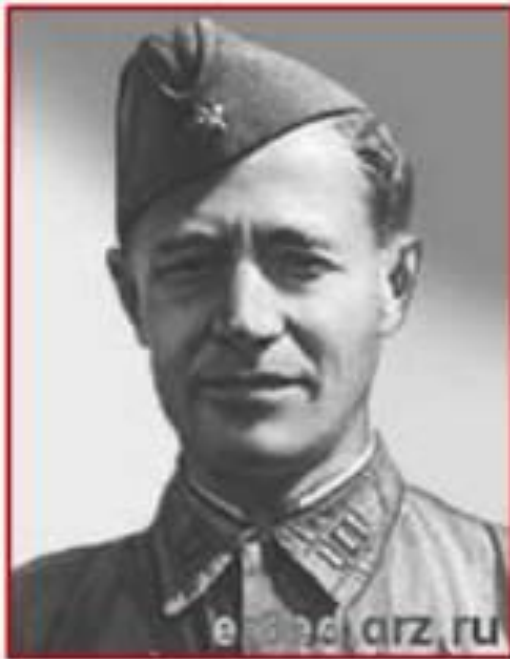
Поэт А.А. Сурков