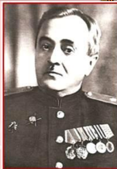
Композитор А.В. Александров