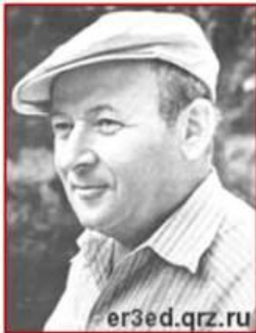
Поэт К.Я. Ваншенкин