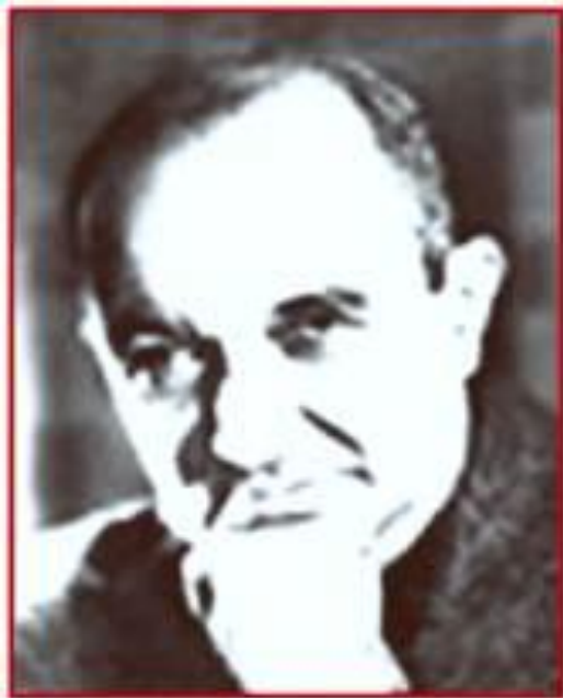
Поэт В.Г. Агатов