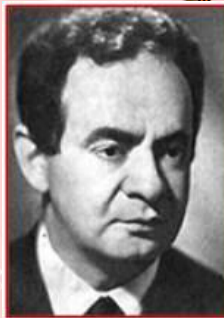
Композитор Э.С. Колмановский