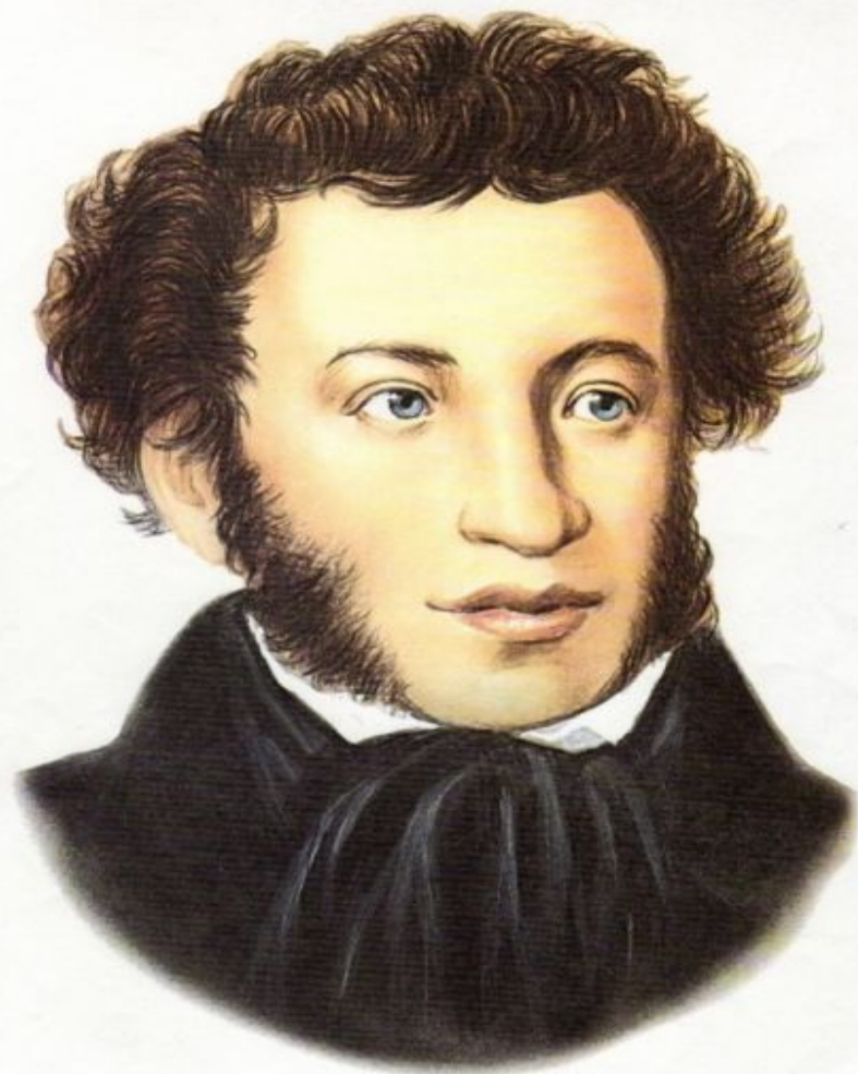
Пушкин Александр Сергеевич (1799-1837)