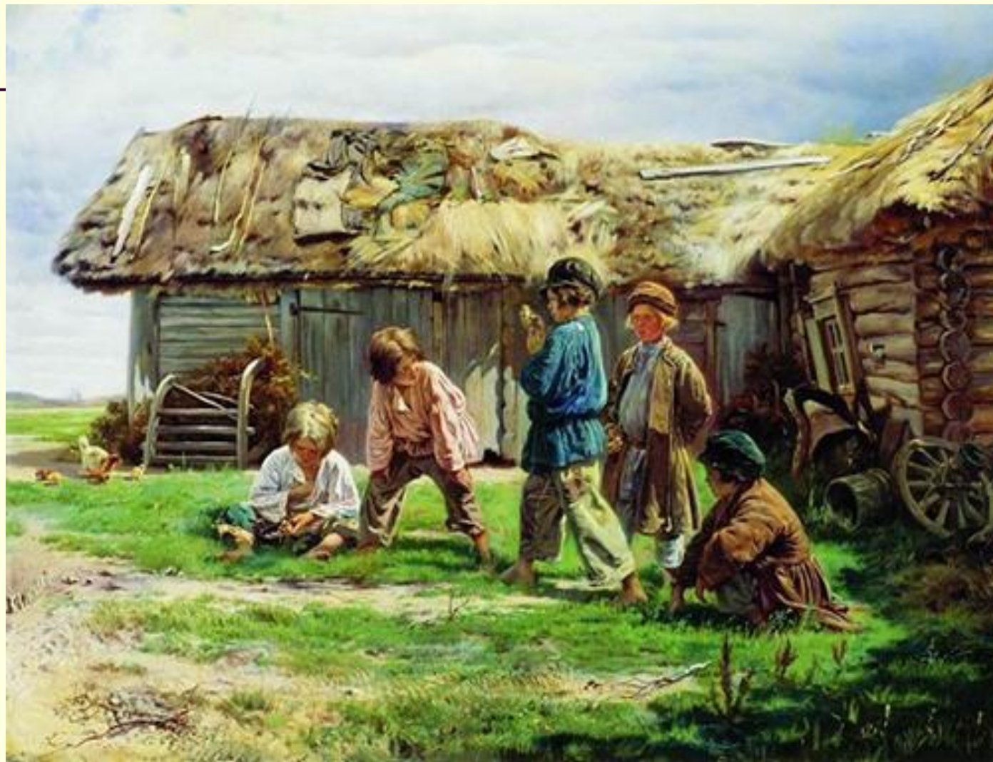
«Игра в бабки»