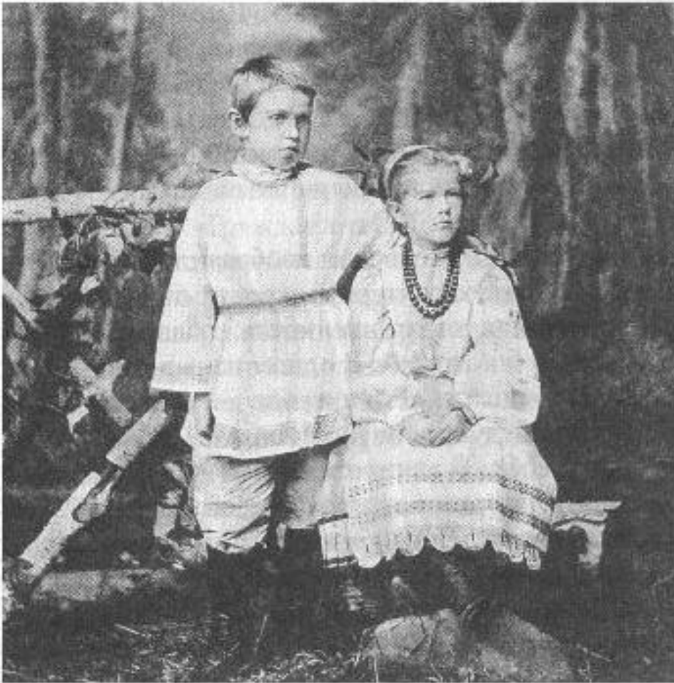
Любовь и Фёдор Достоевские, дети писателя.

Роман "Бесы" (1871-72) - памфлет на русское революционное движение 60-х - начала 70-х гг. В публицистической форме Достоевский пропагандировал свои политические и философские взгляды в ежемесячном издании "Дневник писателя" (1873, 1876-77, 1880-81).