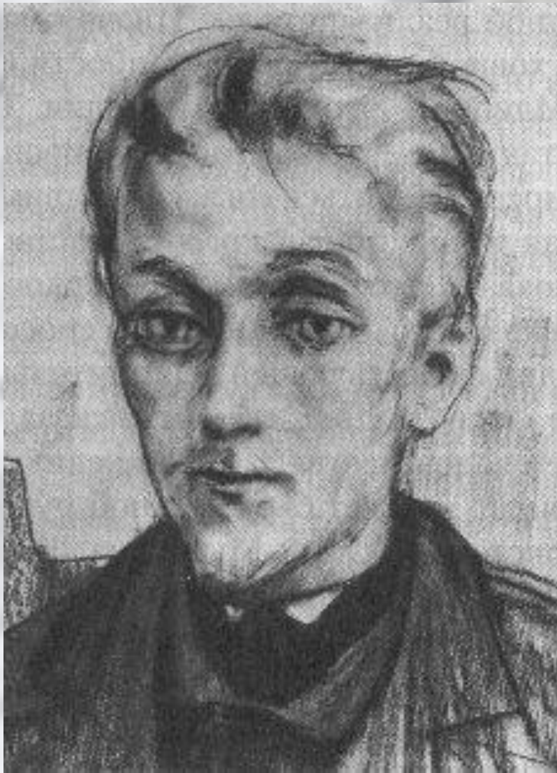
«Идиот». Князь Мышкин

1860-70 - созданы крупнейшие романы - "Преступление и наказание" (1866), "Идиот" (1868), в котором Достоевский стремился создать характер идеально прекрасного человека в лице князя Мышкина. В образе Настасьи Филипповны изображена трагедия женщины, вынужденной продавать свою красоту и не желающей мириться с унижением её человеческого, женского достоинства.