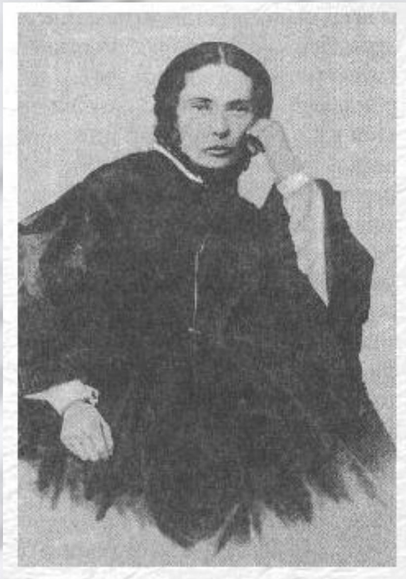
М.Д. Исаева, первая жена Ф.М. Достоевского.