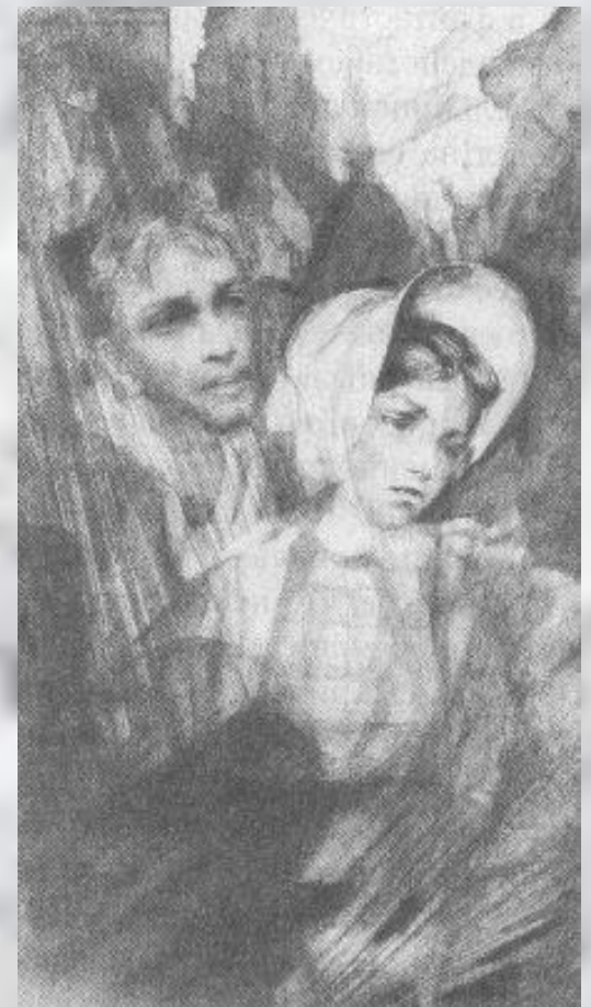
"Белые ночи". Настенька и мечтатель.

1846 - первая повесть, "Бедные люди". В других произведениях 40-х гг. - "Двойник" (1846), "Белые ночи" (1848), "Неточка Незванова" (1849) - возникает тема психологической двойственности человека, характерная и для позднего периода творчества.