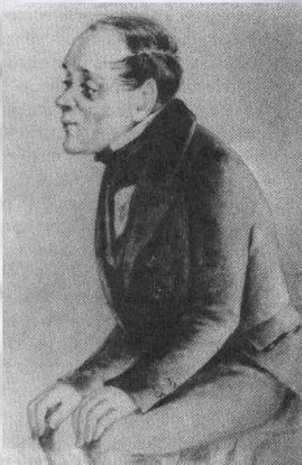
«Бедные люди» Макар Девушкин.

1846 - первая повесть, "Бедные люди". В других произведениях 40-х гг. - "Двойник" (1846), "Белые ночи" (1848), "Неточка Незванова" (1849) - возникает тема психологической двойственности человека, характерная и для позднего периода творчества.