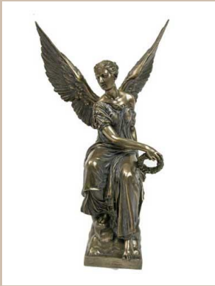
Ника – богиня победы