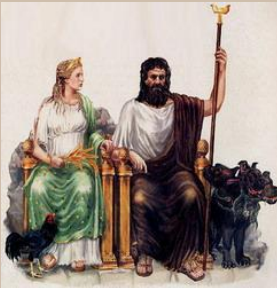
Аид и Персефона