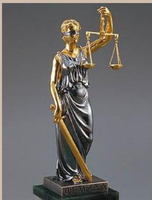
Богиня правосудия Фемида