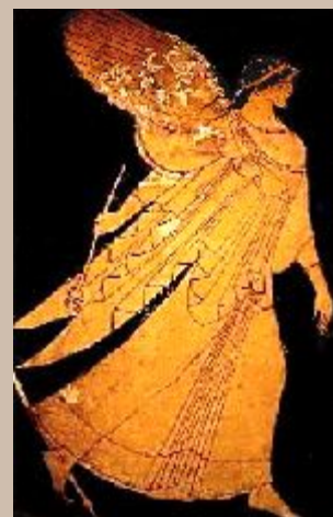
Ирида – богиня радуги