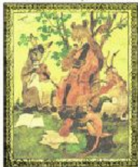
Квартет Рисунок С. Яковлева

... у Крылова всякое животное имеет свой, индивидуальный характер... лисица у него везде хитрая, бессовестная и более похожа на человека, чем на лисицу, и косолапый мишка везде добродушно-честный, неповоротливо-сильный, лев – грозно-могучий, величественно страшный. Столкновение этих существ у Крылова всегда образует маленькую драму. В. Г. Белинский