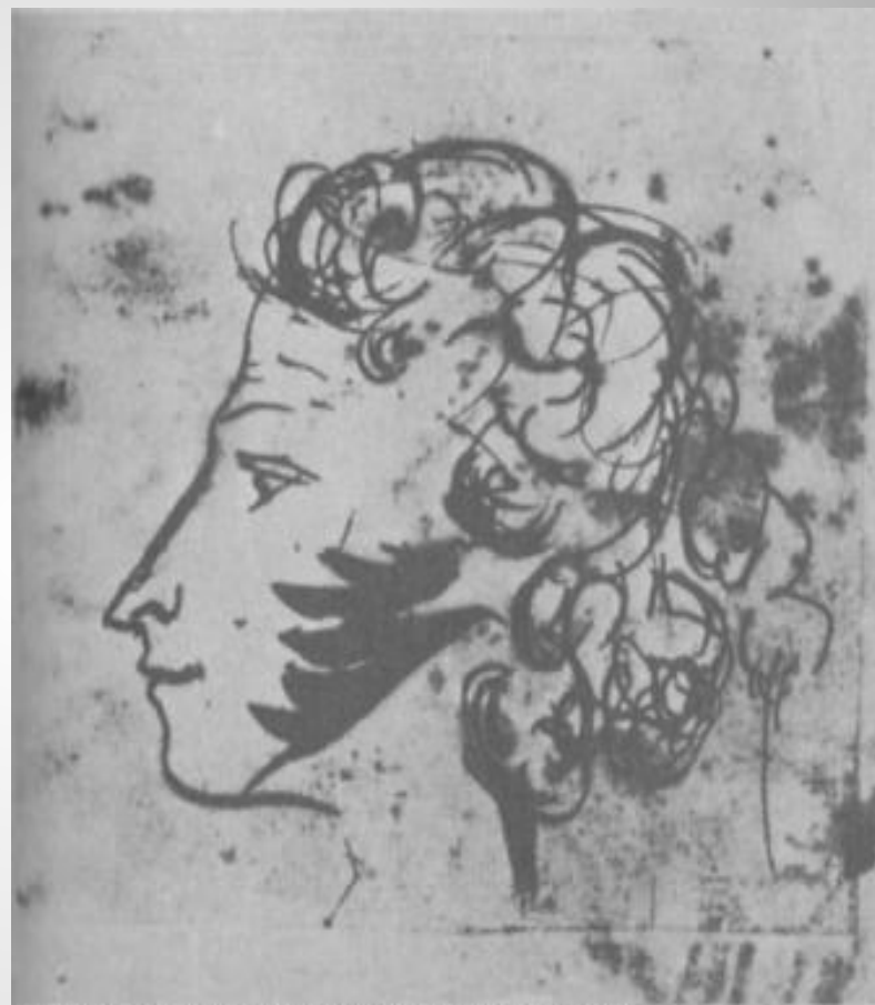
Автопортрет, вклеенный в Ушаковский альбом. 1829 г.

Это типичный для графики Пушкина профильный портрет. Лист с ним вклеен в альбом сестёр Ушаковых, молодых приятельниц поэта. Как и в других автопортретах, Пушкин не стремится приукрасить своё лицо. Он знает, что внешней красотой не обладает, и не прочь даже пококетничать этим ("потомок негров безобразный", "мой арапский профиль... его освищет Мефистофель"). Неотразимое обаяние лицу придают озаряющие его ум, одухотворённость, непосредственность.