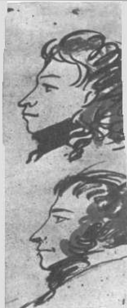
Два автопортрета. Сент.-окт. 1826 г.