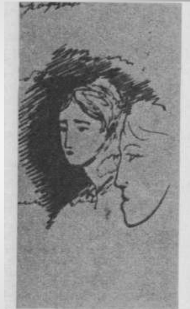
Н.Н.Пушкина. Окт. 1833 г.

Не раз рисовал Пушкин Наталью Николаевну – насчитывается четырнадцать её портретов, с 1830 по 1836 год. Этот портрет самый выразительный, самый психологический и самый красивый. Именно по этому пушкинскому портрету мы представляем себе облик жены Пушкина – лучше, чем по единственному портрету её, современному годам её брака с Пушкиным, акварели Александра Брюллова. Редкий для Пушкина портрет в три четверти, погрудный. Резко оттеняет он чёрной штриховкой чистый овал её лица, гибкую шею и широкие плечи. Красивые пропорции лица, чуть косящий глаз, некоторая неправильность бровей. Грустное выражение лица.