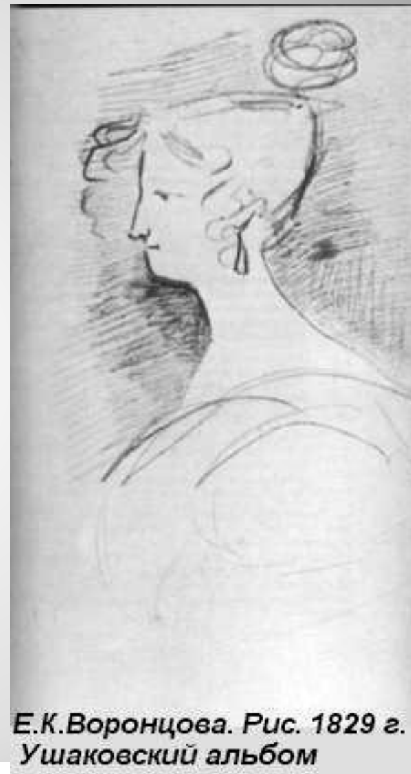
Е.К.Воронцова. Рис. 1829 г. Ушаковский альбом

Воспроизводимый здесь портрет нарисован на большом листе бумаги. Это самый большой, смелый и уверенный из всех тридцати набросков Елизаветы Ксаверьевны, сделанных Пушкиным. Выразительность и кокетливость подвижного лица Воронцовой делали её неотразимо привлекательной, хотя в основе своей черты её не были красивы. Пушкин лица её не идеализировал. Но он передал одно из главных очарований Воронцовой – красивую посадку её головы и тонкую, длинную шею, которую старательно оттушеввал, найдя точные соотношения линий.