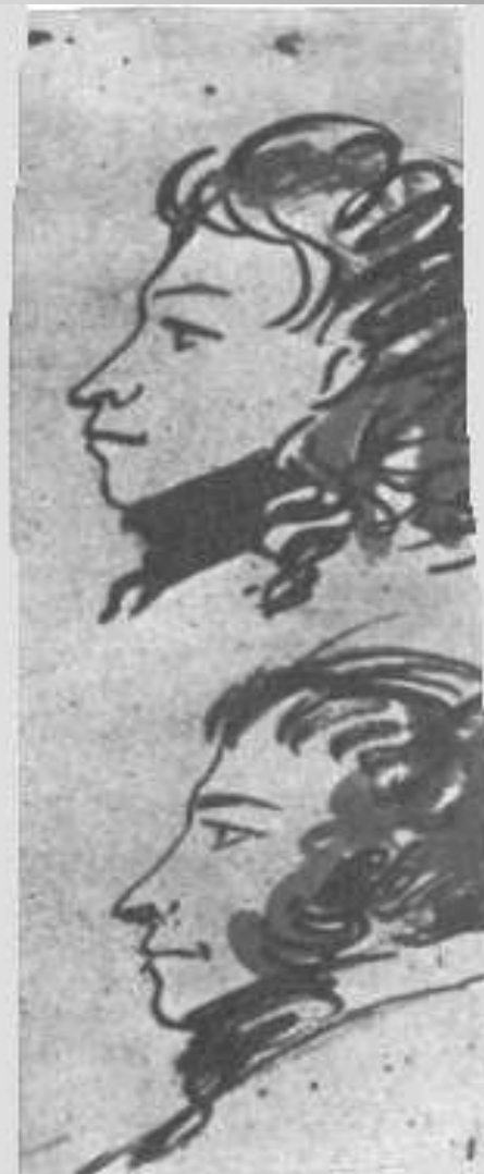
Два автопортрета. Сент.-окт. 1826 г.