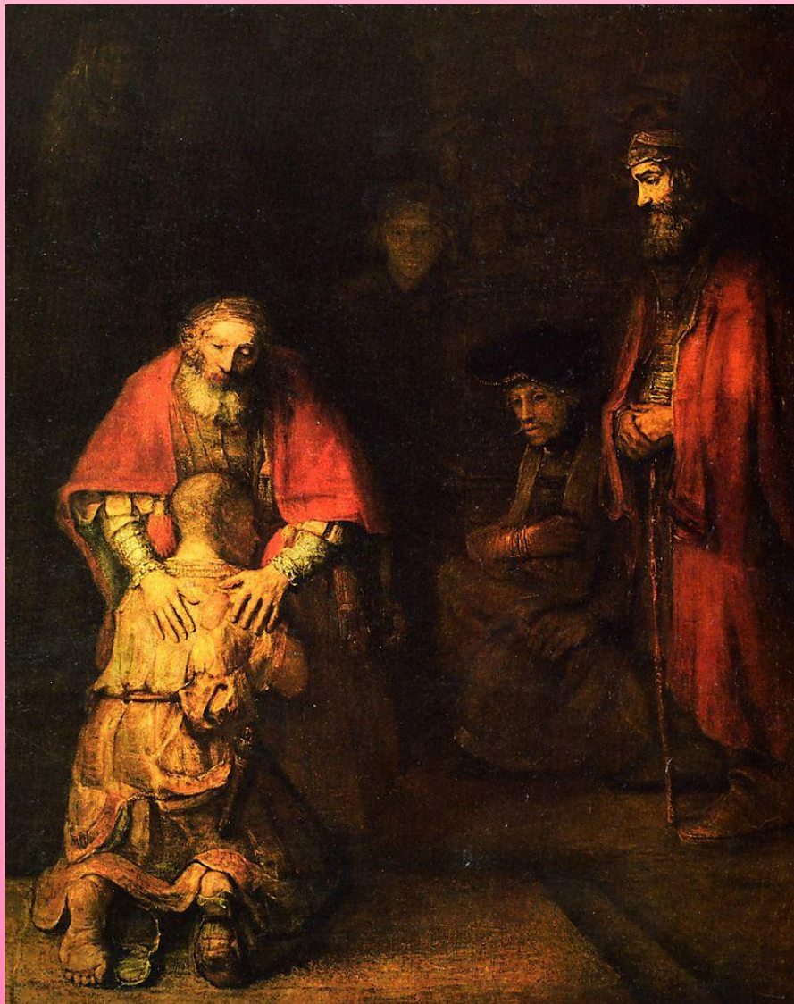
Рембрандт «Возвращение блудного сына»