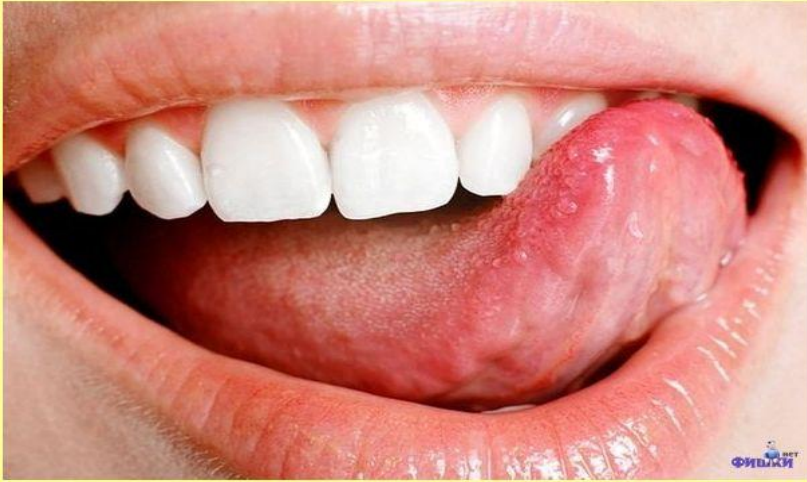
Самая сильная мышца в человеческом организме - язык.