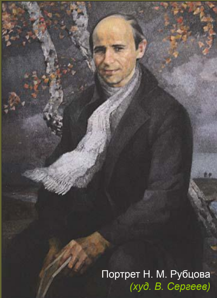
Портрет Н. М. Рубцова (худ. В. Сергеев)