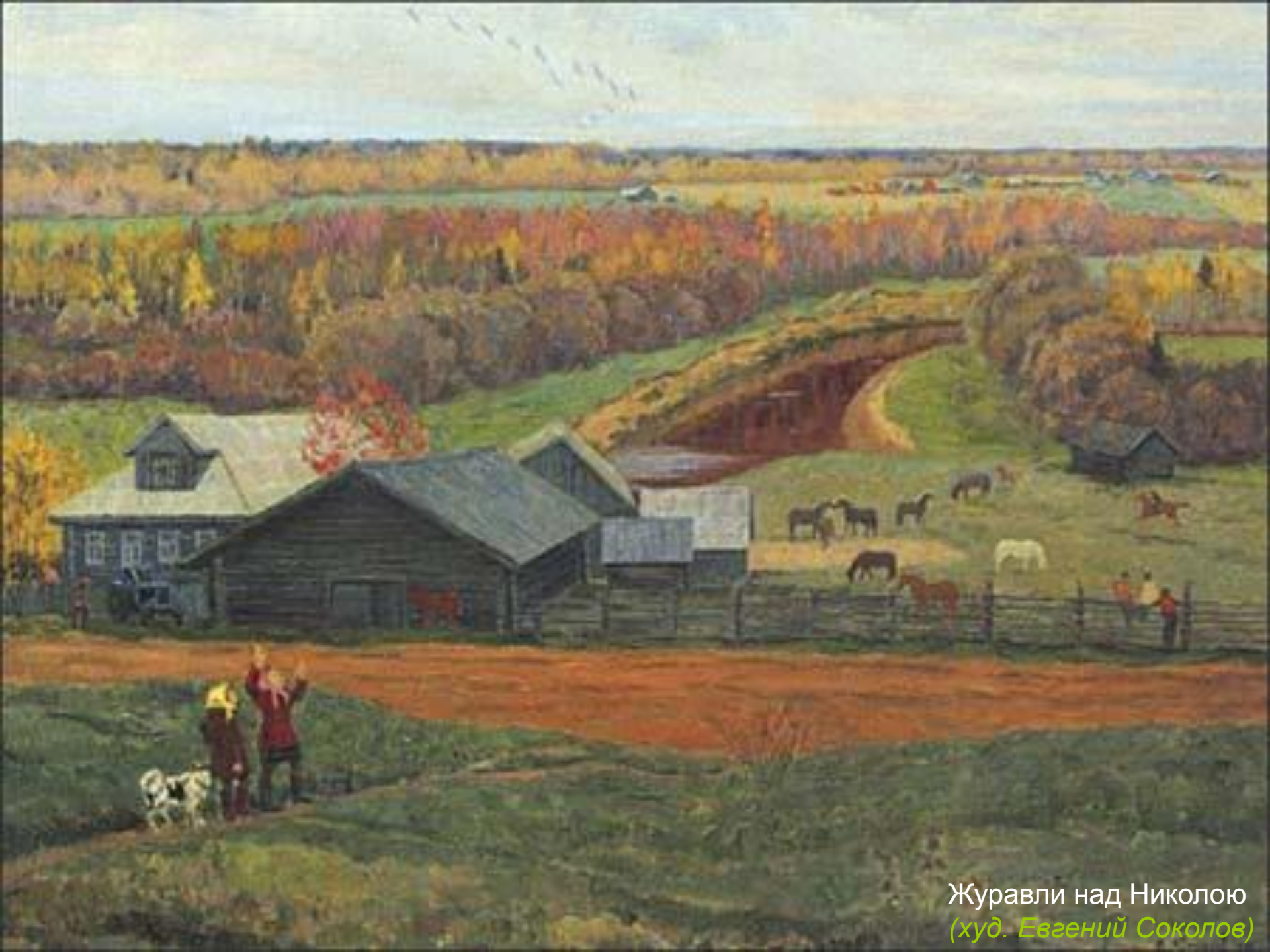
Журавли над Николою (худ. Евгений Соколов)