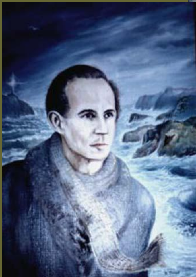
Волны и скалы. Портрет Н. М. Рубцова (худ. В. Тауров)