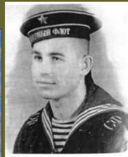
Северный флот. 1955-1959 г.г.