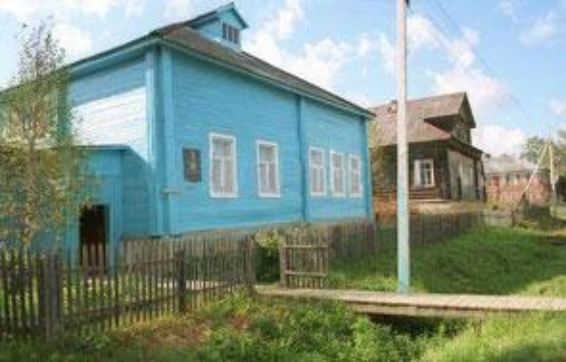
Музей Н. М. Рубцова в Никольском