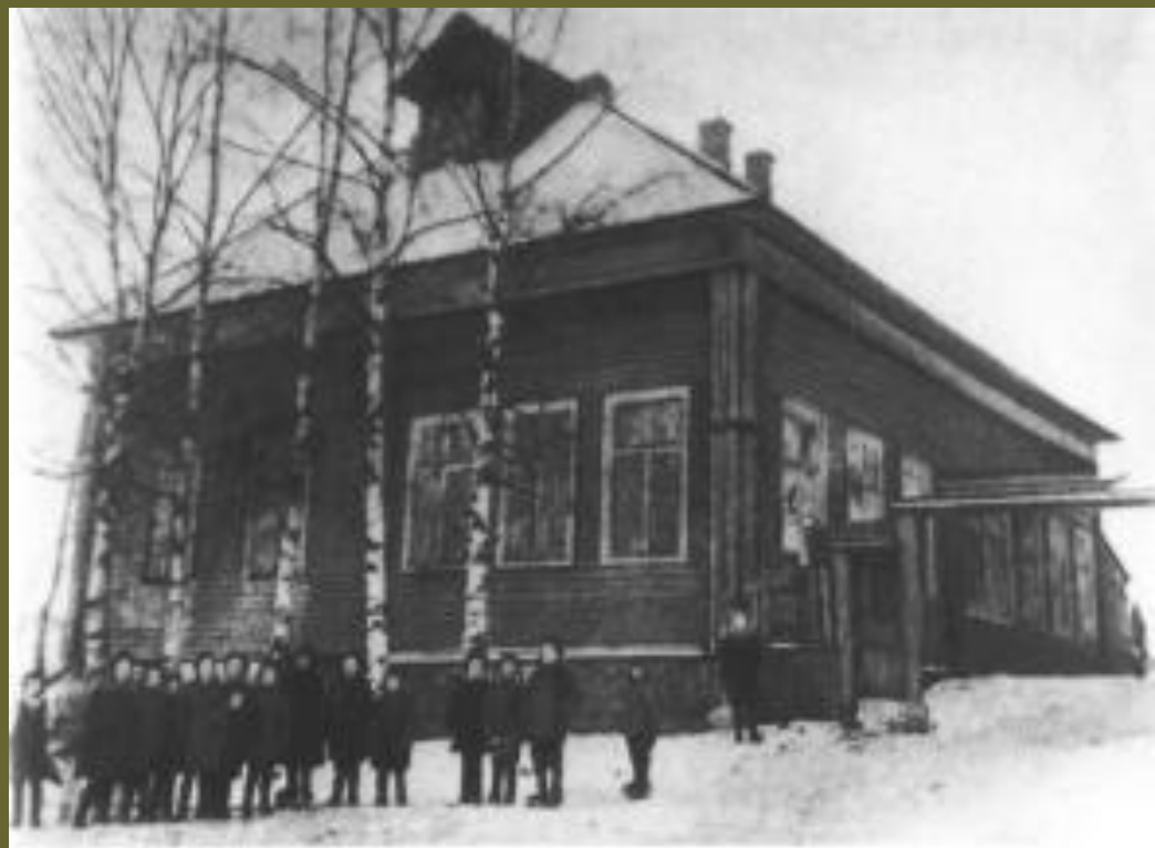
Детский дом в с.Никольское, где в 1943-1950 гг. жил Н. Рубцов