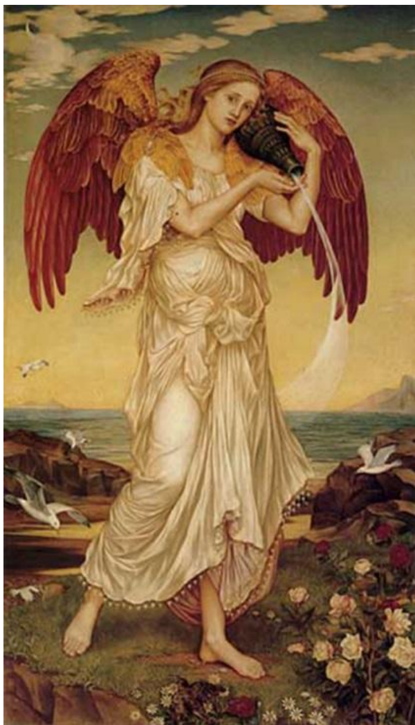
Богиня утренней зари Аврора