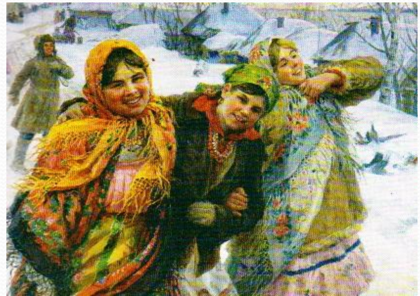
Праздничный день. Подруги с картины Ф. Сычкова

Розовой дымкой парят облака В снегом покрытой деревне... Сверху змеится дорога - река... Праздничный день. Воскресение.