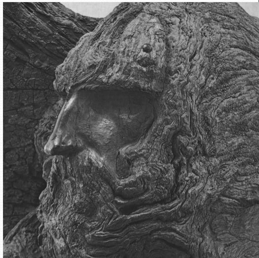
Александр Невский по скульптуре Эрззи