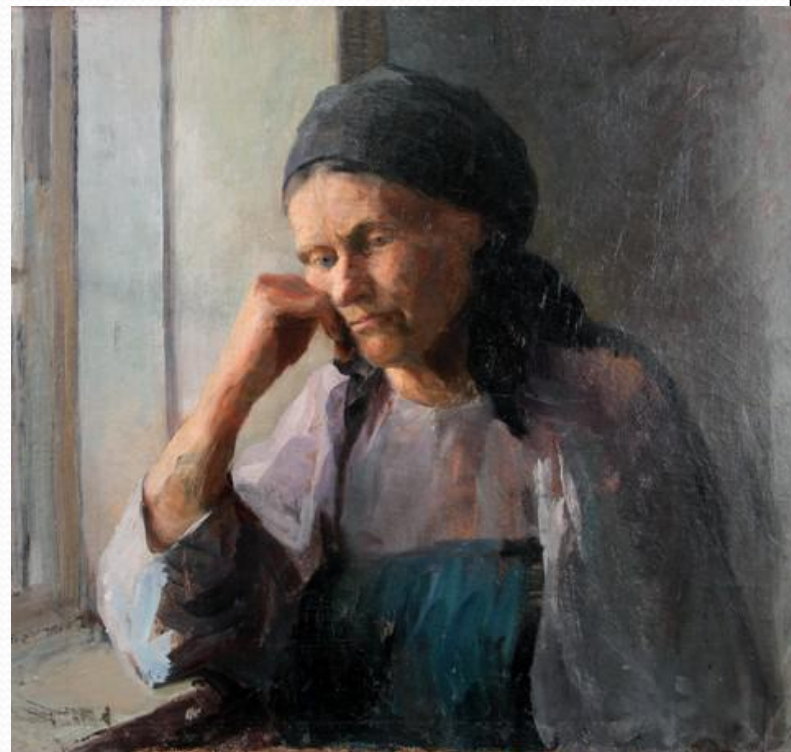
Мать (Ф. Сычков)

Мама, я прилечу, обниму и заплачу, У тебя на груди расскажу про удачу... Я останусь всегда твоей дочкой послушной, Ну, а ты иногда мои песни послушай!