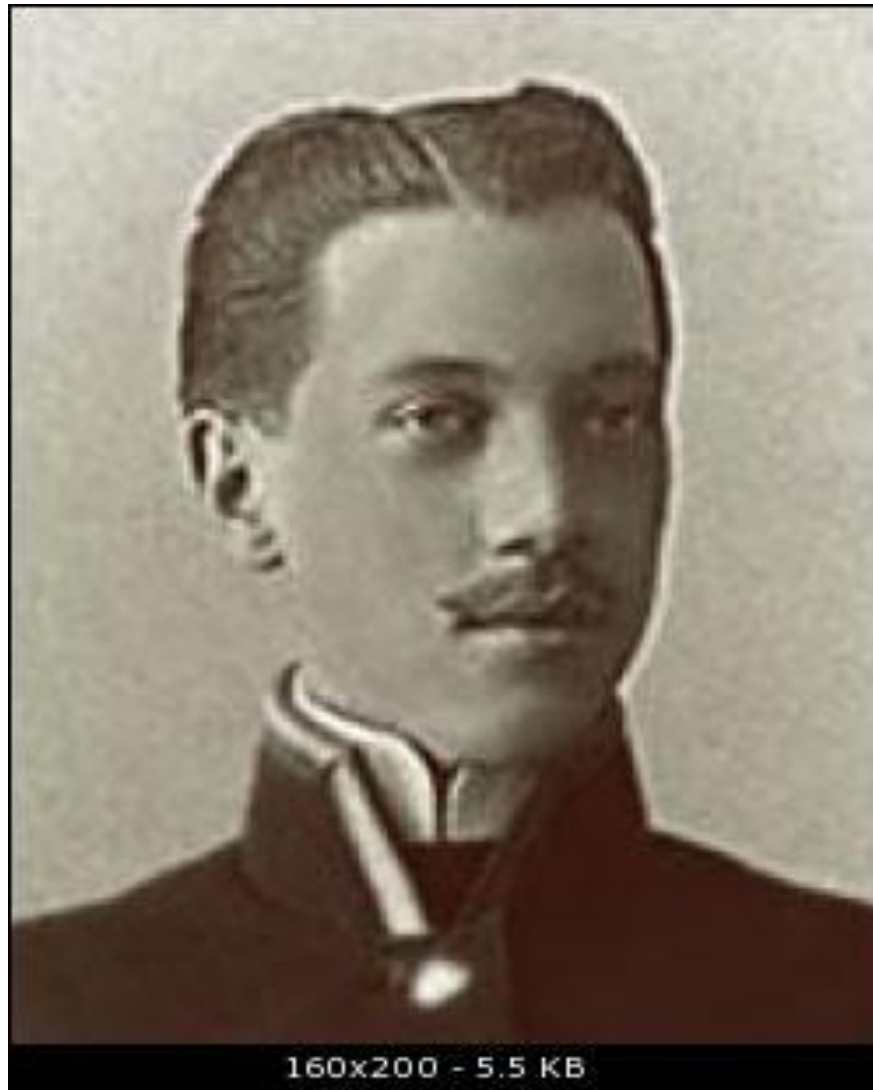
Николай Гумилев (1886-1921)