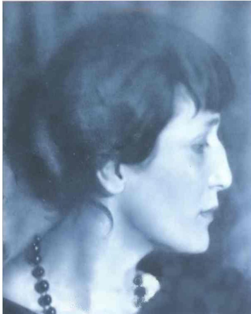
Анна Ахматова (1889-1966)