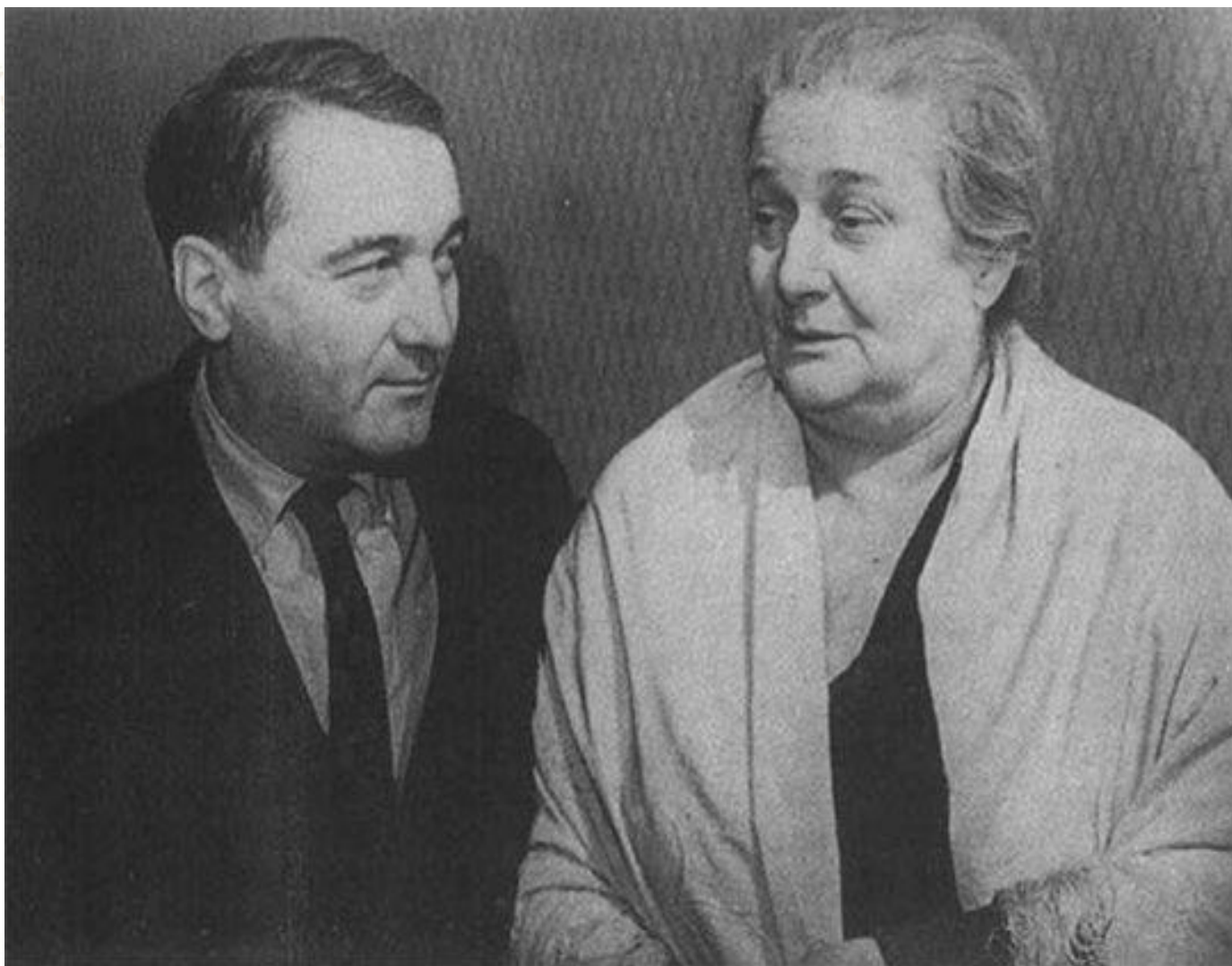
Анна Ахматова и Лев Гумилев