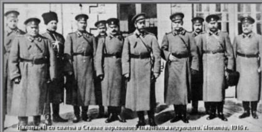
Генералы со свитой в Станке Верховного Штаба Красной Армии. Москва, 1918 г.