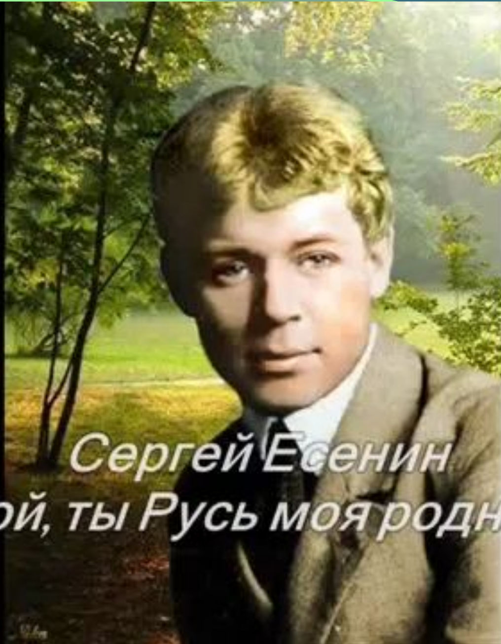
Сергей Есенин "Гой, ты Русь моя родная"