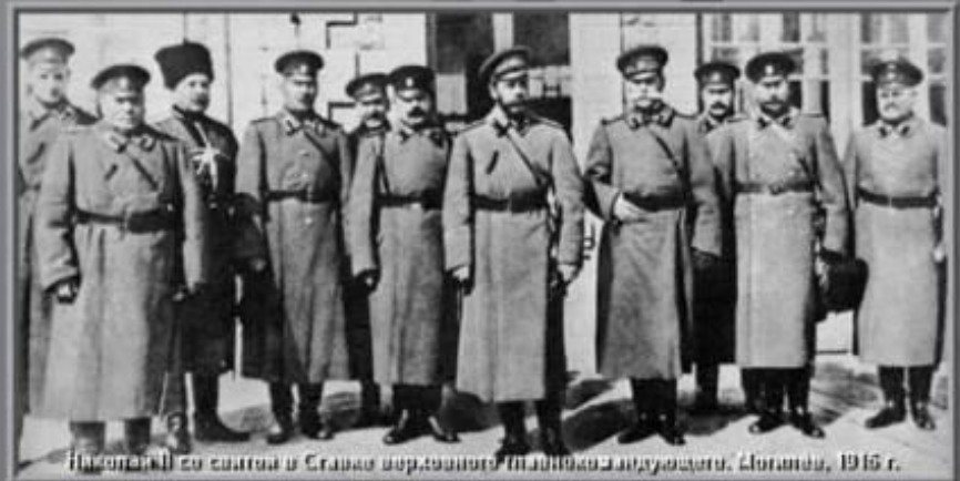
Генералы со свитой в Станке Верховного Штаба Красной Армии. Москва, 1918 г.