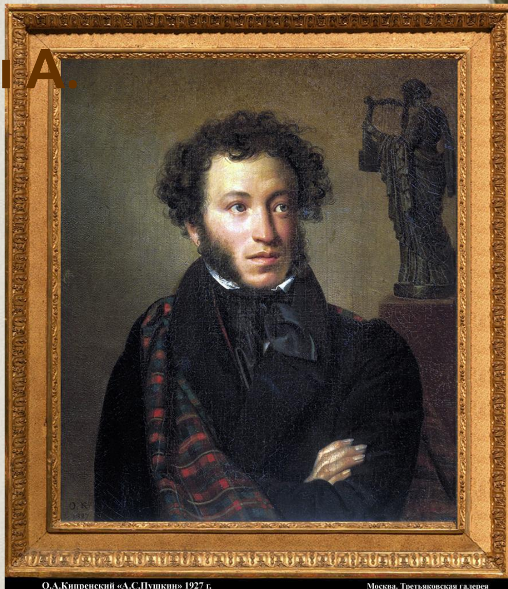
О.А.Кипренский «А.С.Пушкин» 1927 г.

А.С.Пушкин видел задачу прозы в том, чтобы «... изъяснить просто вещи самые обыкновенные»