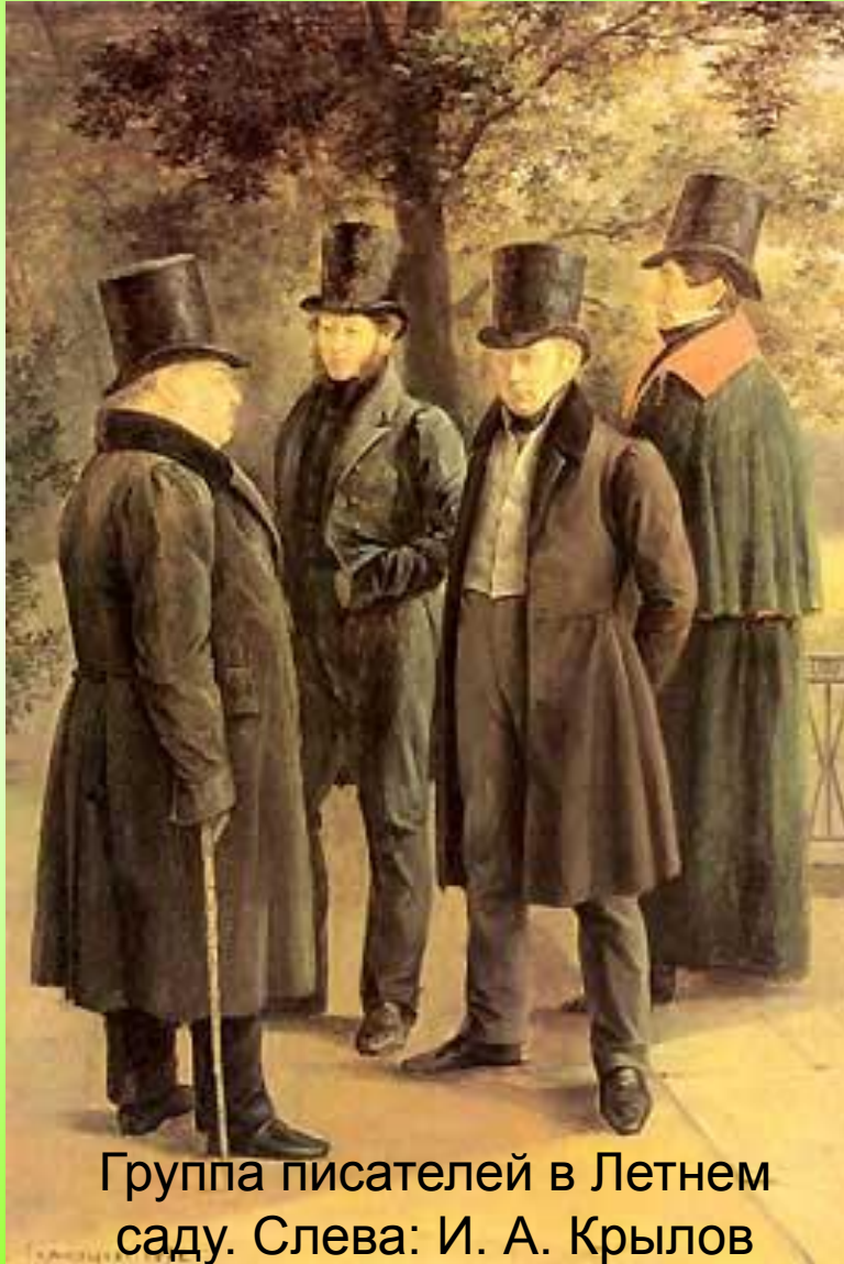
Группа писателей в Летнем саду. Слева: И. А. Крылов