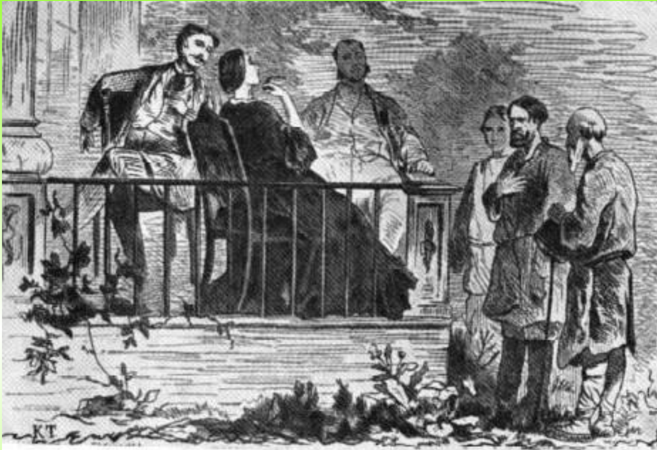
«Листы и Корни» Гравюра по рисунку К. Трутовского. 1864 г.

В басне «Листы и Корни» Крылов пишет о равном участии власти и народа в достижении общественного блага.