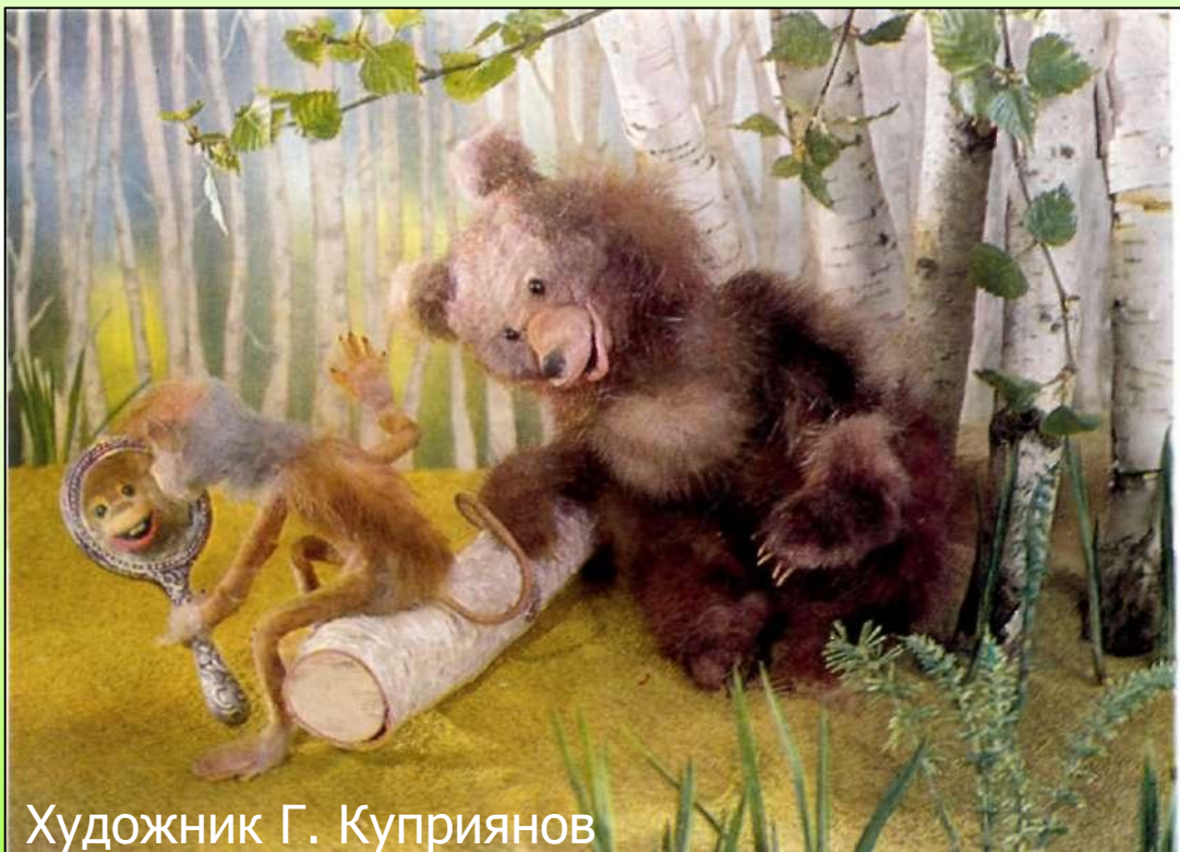
Художник Г. Куприянов

Чем кумушек считать трудиться, не лучше ль на себя, кума, оборотиться?