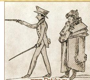
В. К. Кюхельбекер и К. Ф. Рылов на Сенатской площади 14 декабря 1825 года. Рис. А. С. Пушкина (1).

Известие о смерти Александра I застало врасплох членов Северного общества, которые, чтобы избежать обсуждения вопроса о цареубийстве, решили приурочить революционное выступление к моменту смерти монарха. Рылеев сделался одним из инициаторов и руководителей подготовки восстания 14 декабря 1825 на Сенатской площади. В дни междуцарствия он был болен ангиной, и его дом стал центром совещаний заговорщиков, приходивших будто бы проведать больного. Рылеев, воодушевляя товарищей, сам не мог эффективно участвовать в восстании, поскольку был штатским. Утром 14 декабря он пришел на Сенатскую площадь, затем покинул ее и большую часть дня провел в разъездах по городу, стараясь выяснить ситуацию в разных полках и найти подмогу.