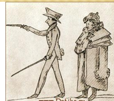
В. К. Кюхельбекер и К. Ф. Рылеев на Сенатской площади 14 декабря 1825 года. Рис. А. С. Пушкина (1).

Известие о смерти Александра I застало врасплох членов Северного общества, которые, чтобы избежать обсуждения вопроса о цареубийстве, решили приурочить революционное выступление к моменту смерти монарха. Рылеев сделался одним из инициаторов и руководителей подготовки восстания 14 декабря 1825 на Сенатской площади. В дни междуцарствия он был болен ангиной, и его дом стал центром совещаний заговорщиков, приходивших будто бы проведать больного. Рылеев, воодушевляя товарищей, сам не мог эффективно участвовать в восстании, поскольку был штатским. Утром 14 декабря он пришел на Сенатскую площадь, затем покинул ее и большую часть дня провел в разъездах по городу, стараясь выяснить ситуацию в разных полках и найти подмогу.