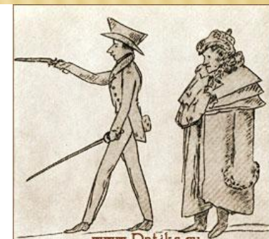
В. К. Кюхельбекер и К. Ф. Рылев на Сенатской площади 14 декабря 1825 года. Рис. А. С. Пушкина (1).

Известие о смерти Александра I застало врасплох членов Северного общества, которые, чтобы избежать обсуждения вопроса о цареубийстве, решили приурочить революционное выступление к моменту смерти монарха. Рылеев сделался одним из инициаторов и руководителей подготовки восстания 14 декабря 1825 на Сенатской площади. В дни междуцарствия он был болен ангиной, и его дом стал центром совещаний заговорщиков, приходивших будто бы проведать больного. Рылеев, воодушевляя товарищей, сам не мог эффективно участвовать в восстании, поскольку был штатским. Утром 14 декабря он пришел на Сенатскую площадь, затем покинул ее и большую часть дня провел в разъездах по городу, стараясь выяснить ситуацию в разных полках и найти подмогу.