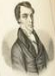
Константин Федорович Рылов