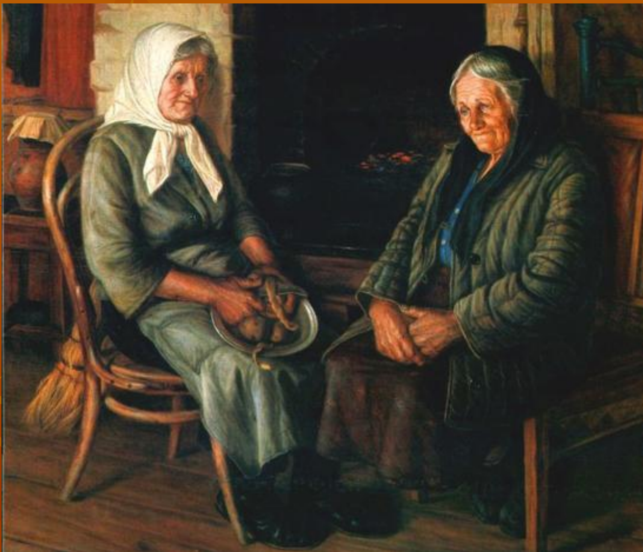
А. М. Шилов. Солдатские матери