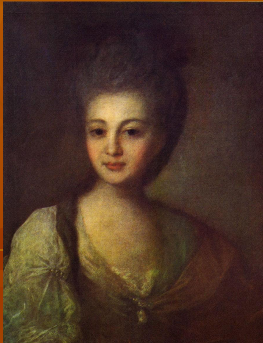
Ф. С. Рокотов. Портрет Струйской