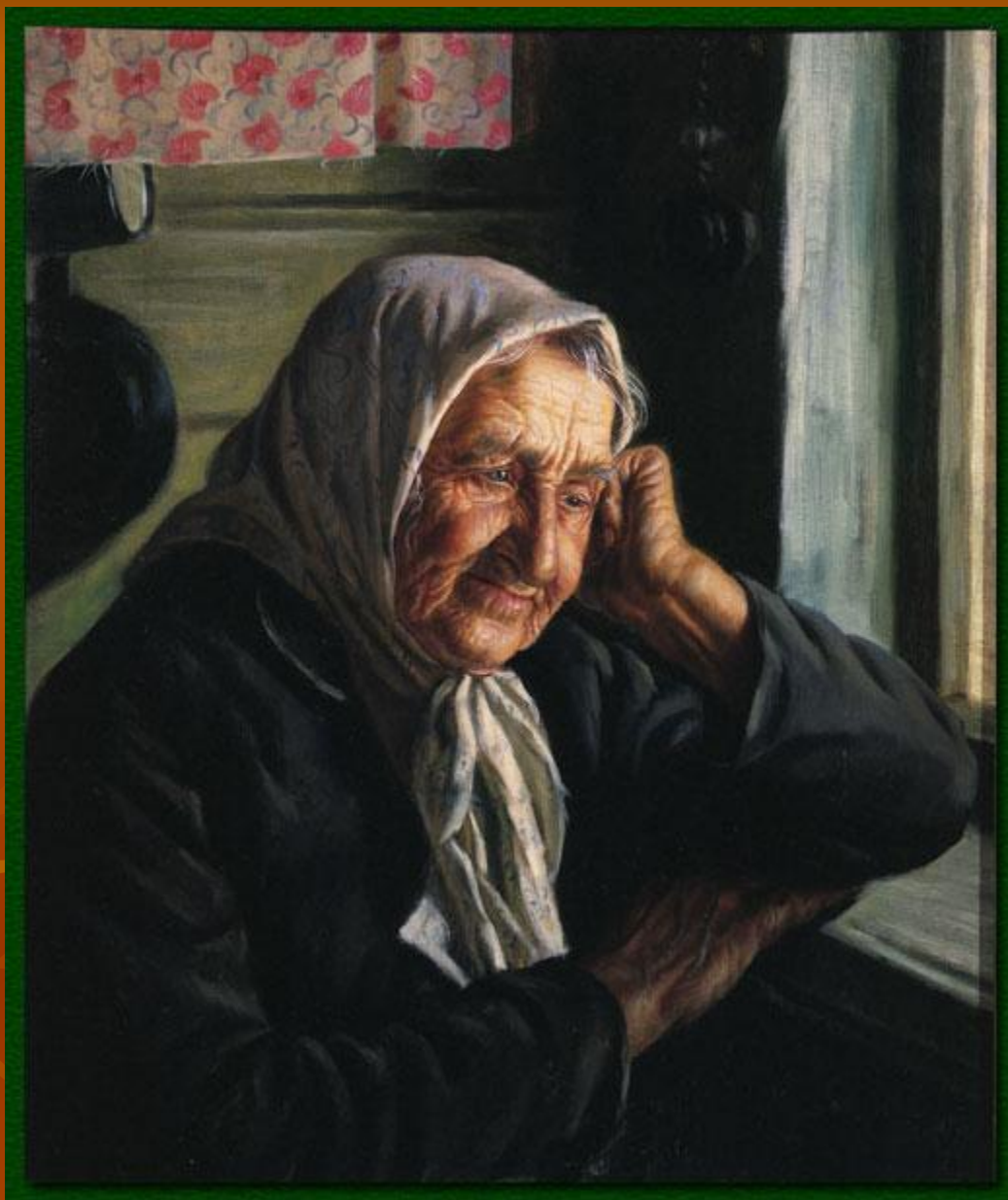
А. М. Шилов. Солдатские матери