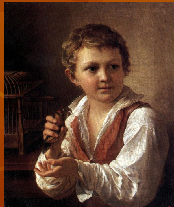
В. А. Тропинин Мальчик с щегленком