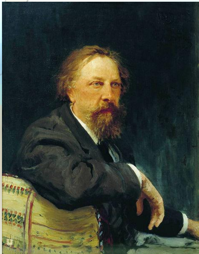
А.К.Толстой Худ. И.Репин, 1879 г.

русский писатель, поэт, драматург, член-корреспондент Петербургской АН (1873), граф.