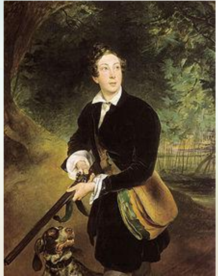
К. П. Брюллов. Портрет Алексея Толстого в юности (1836)

«Я один из двух или трех писателей, которые держат у нас знамя искусства для искусства, ибо убеждение мое состоит в том, что назначение поэта - не приносить людям какую-нибудь непосредственную выгоду или пользу, но возвышать их моральный уровень, внушая им любовь к прекрасному».