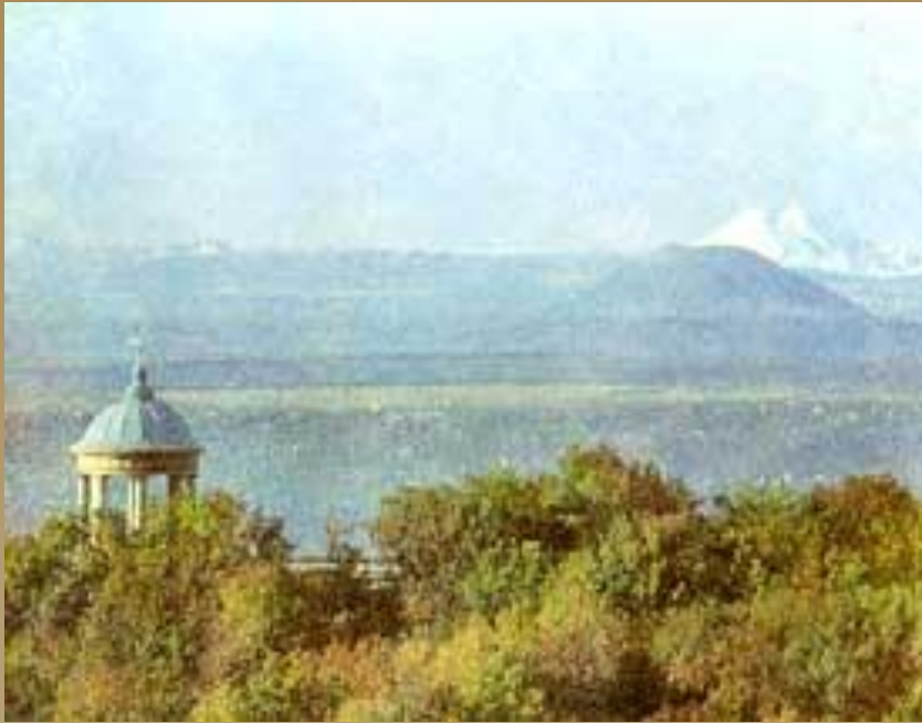
Беседка «Эолова арфа»