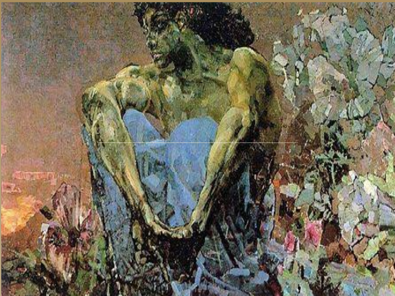
Врубель М. А. Демон сидящий. 1890. Холст. Масло.