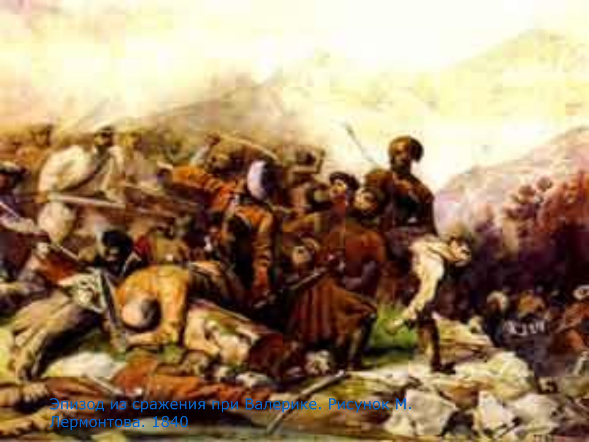
Эпизод из сражения при Валерике. Рисунок М. Лермонтова. 1840