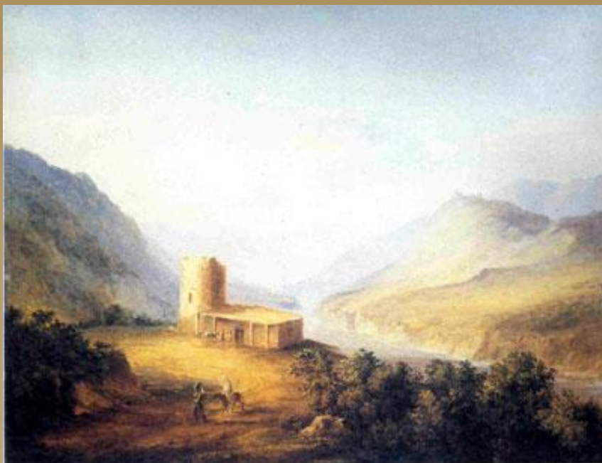
Военно-грузинская дорога близ Мцхета