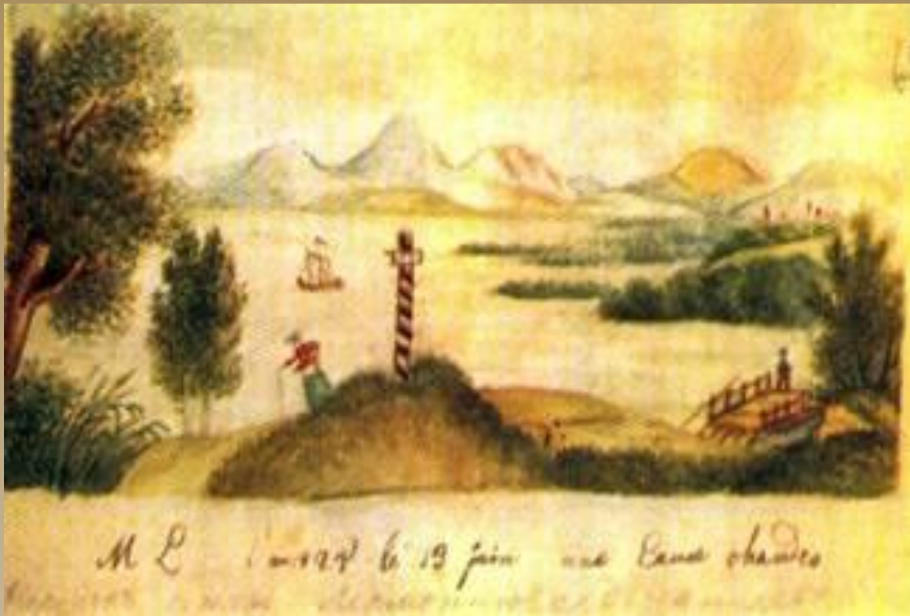
Рисунок юного Лермонтова