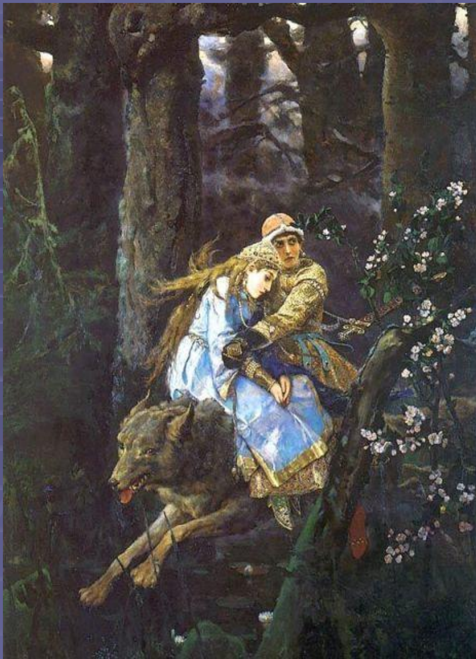
Картина художника В.М. Васнецова „Иван-царевич на Сером Волке“