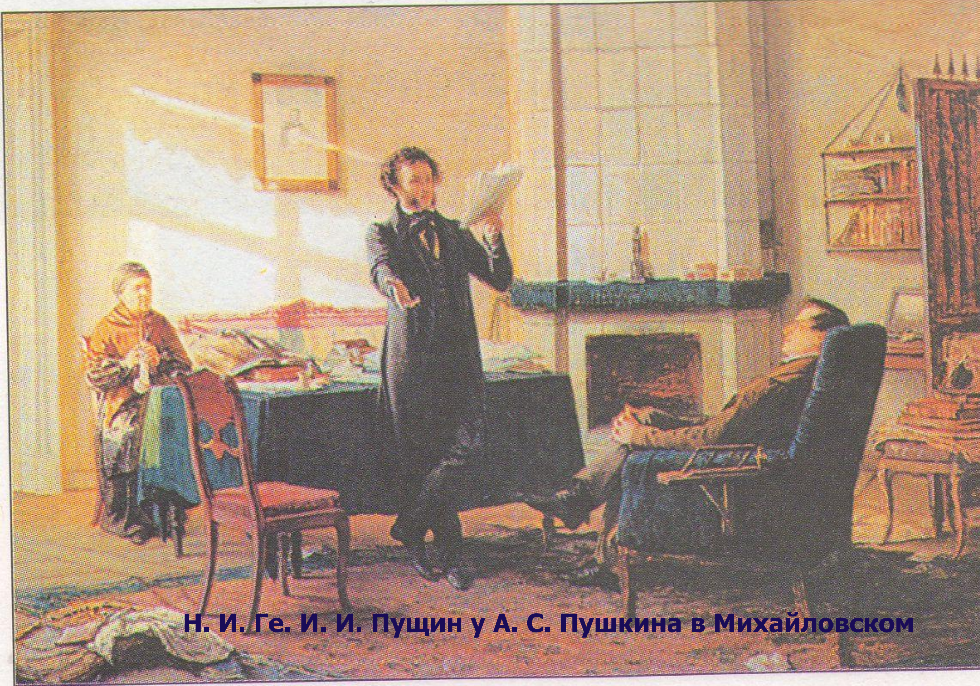
Н. И. Ге. И. И. Пущин у А. С. Пушкина в Михайловском