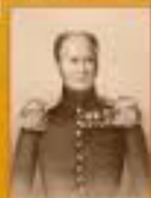
Александр Павлович 1801-1825