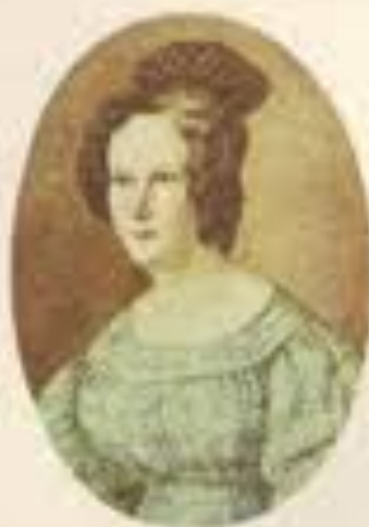
Трубецкая Екатерина Ивановна (1800 – 1834)

Екатерина Ивановна, жена декабриста С.П. Трубецкого, первой проложила путь в Сибирь, выехав вслед за мужем на второй день после его отправки. Она разбила все преграды, поставленные ее сибирской администрацией по приказу Николая I, подписав бумаги, лишавшие ее всяких прав.