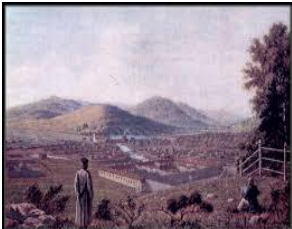
Петровский завод Место срытки дворянства