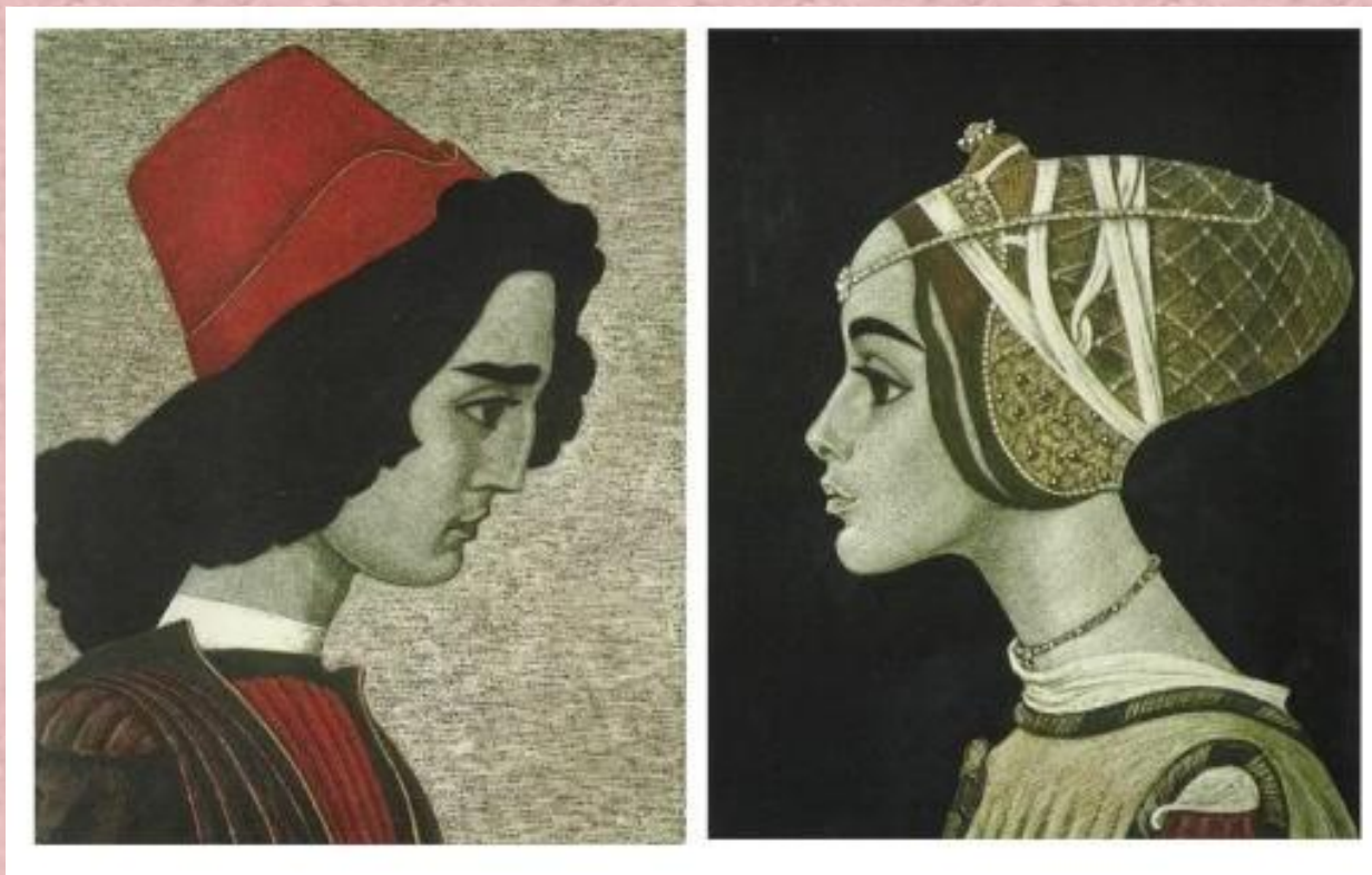
Иллюстрация Саввы Бродского