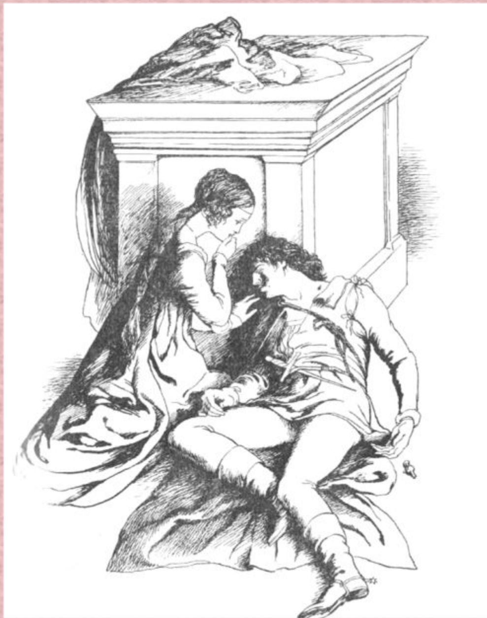
Рис. Н. Архиповой