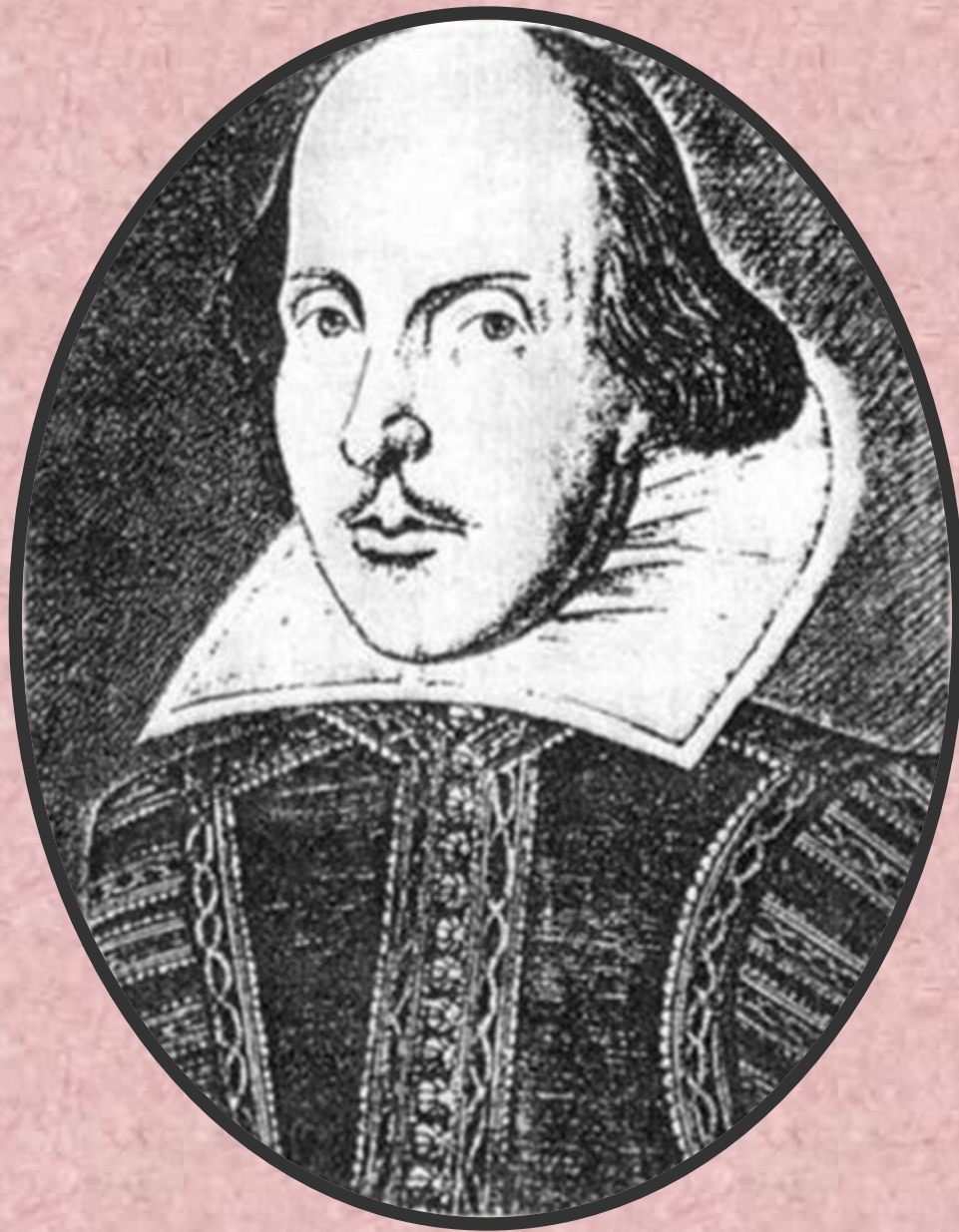
Уильям Шекспир (1564 — 1616)