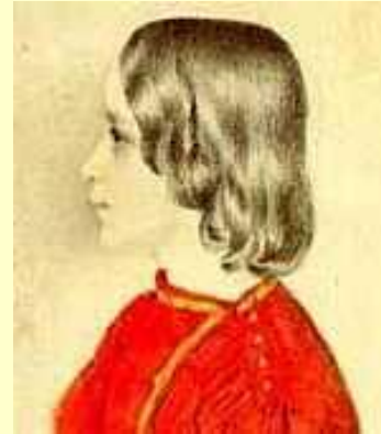
Младший сын, Григорий Александрович Пушкин (1835-1913 г.)