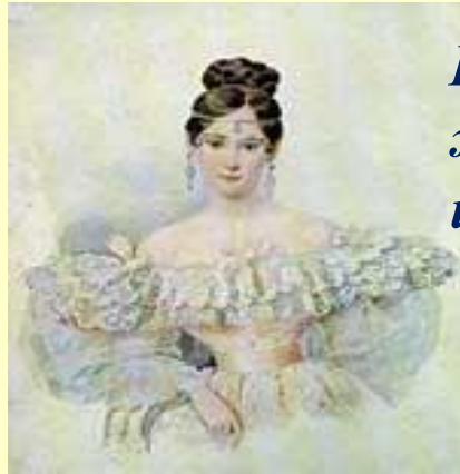
Натали Гончарова - жена А. С. Пушкина. и мать его 4 детей.