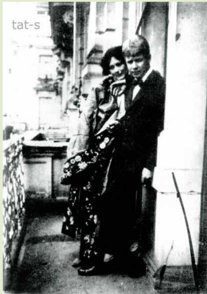
Сергей Есенин и Айседора Дункан, на улицах Венеции. Август 1922 год.