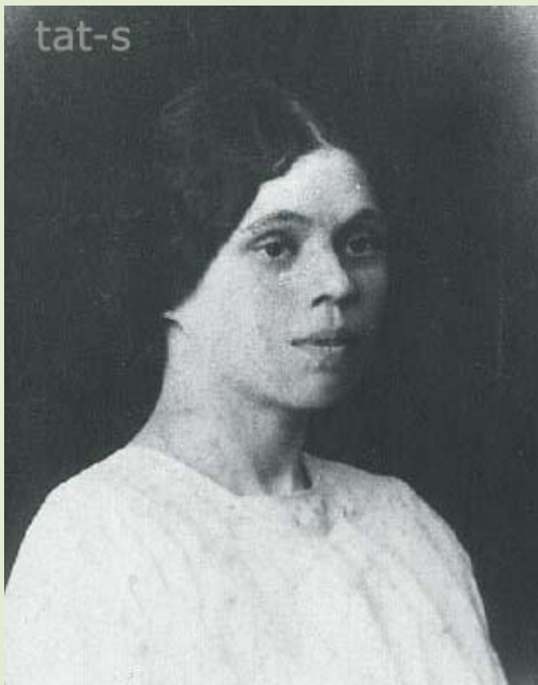
Анна Романовна Изряднова (1891 - 1946).