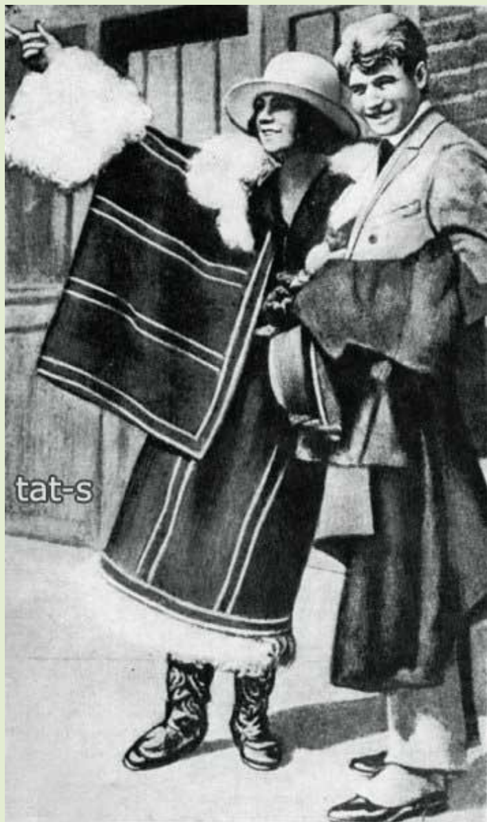
Сергей Есенин и Айседора Дункан на пароходе "Paris". 1 октября 1922 год.