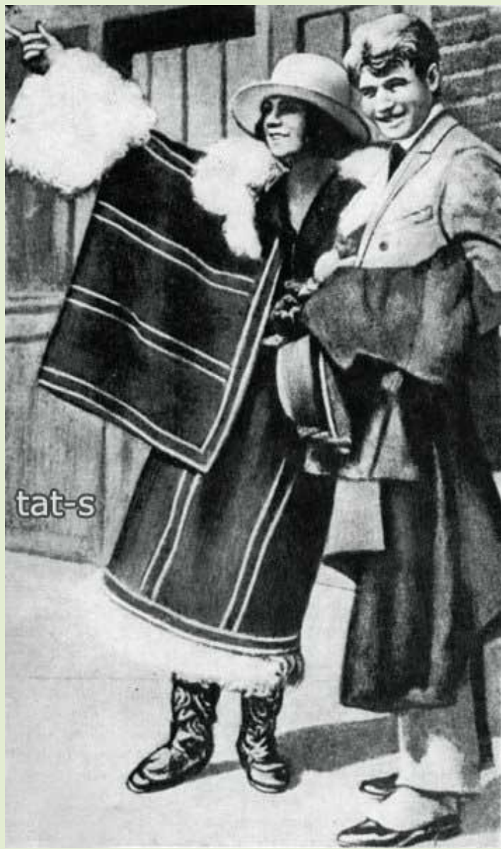
Сергей Есенин и Айседора Дункан на пароходе "Paris". 1 октября 1922 год.