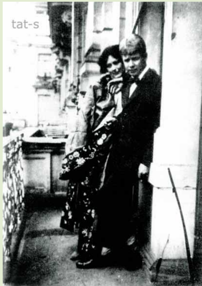
Сергей Есенин и Айседора Дункан, на улицах Венеции. Август 1922 год.