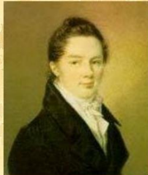
Иван Иванович Пу́цин

Пушкин сохранил лицейскую дружбу и культ Лицея на всю жизнь.