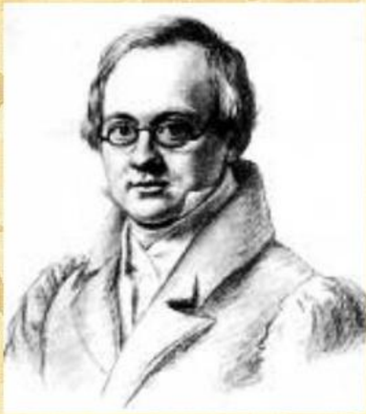
Антон Антонович Дельви́г