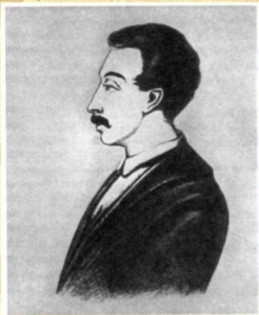
Вильгельм Карлович Кюхельбекер