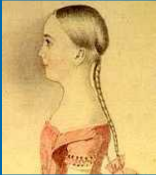
□ Старшая дочь, Мария Александровна Пушкина (1832-1919 г.)