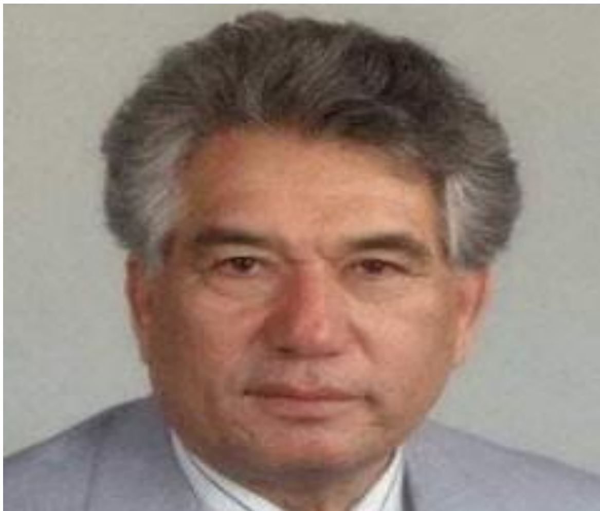
Чингиз Турекулович Айтматов