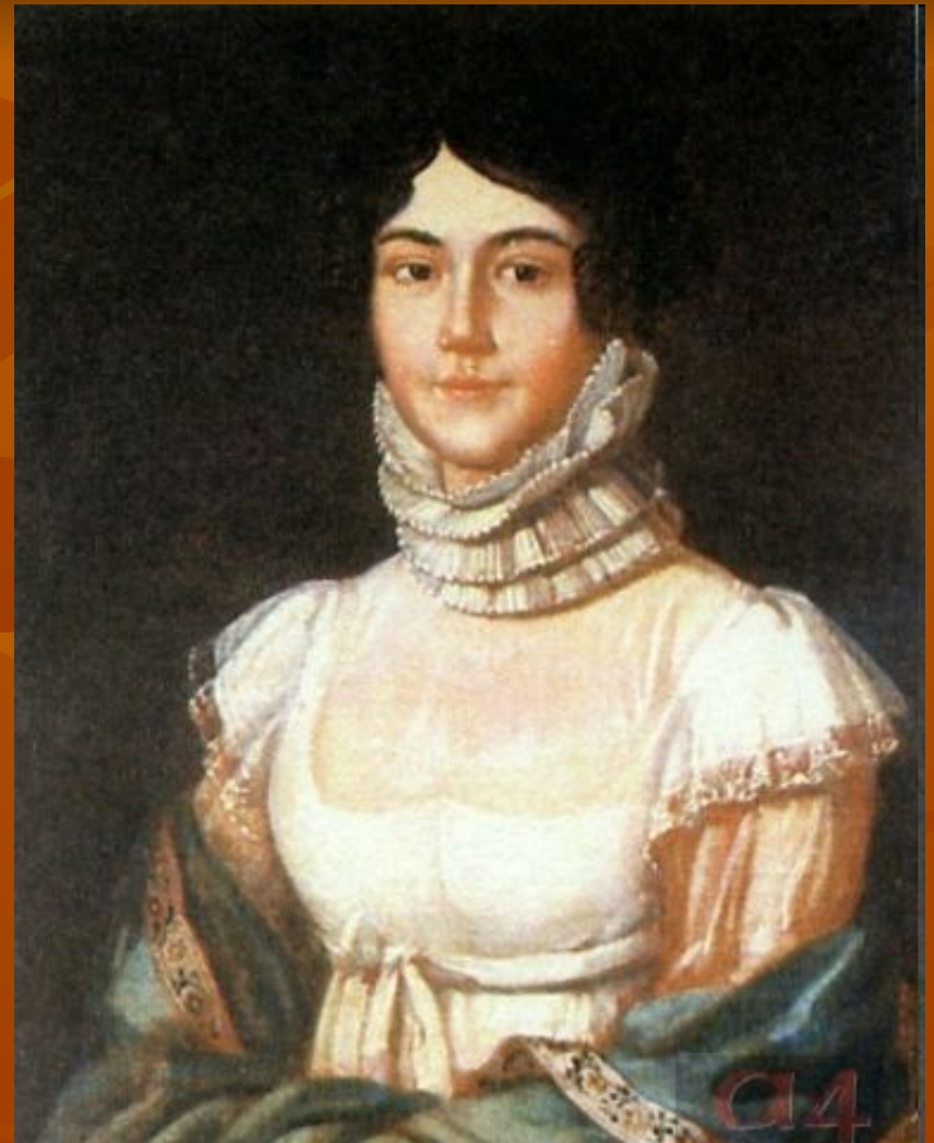
Мария Михайловна Лермонтова, мать поэта. Неизвестный художник. 1810-е

По материнской линии М. Лермонтов происходил из известного в России и богатого дворянского рода Столыпиных.