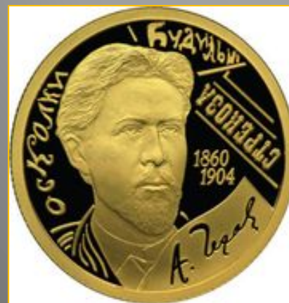
50 рублей из золота