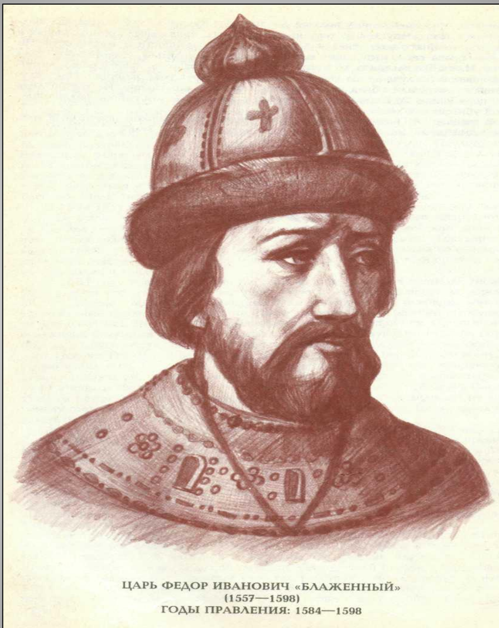
ЦАРЬ ФЕДОР ИВАНОВИЧ «БЛАЖЕННЫЙ» (1557—1598)