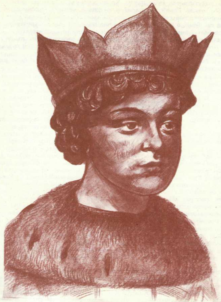
ЦАРЬ ФЕДОР БОРИСОВИЧ ГОДУНОВ (1589—1605) ГОДЫ ПРАВЛЕНИЯ: 1605—1605