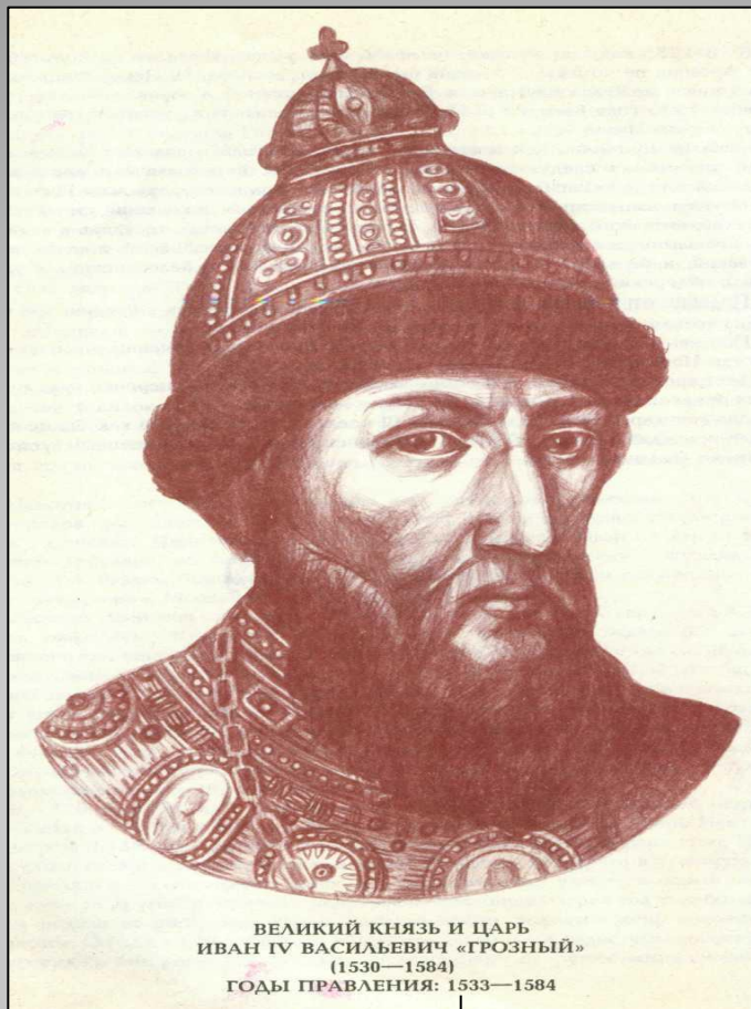
ВЕЛИКИЙ КНЯЗЬ И ЦАРЬ ИВАН IV ВАСИЛЬЕВИЧ «ГРОЗНЫЙ» (1530—1584) ГОДЫ ПРАВЛЕНИЯ: 1533—1584