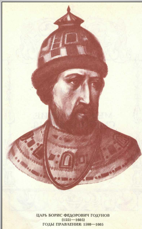
ЦАРЬ БОРИС ФЕДОРОВИЧ ГОДУНОВ (1551—1605) ГОДЫ ПРАВЛЕНИЯ: 1598—1605