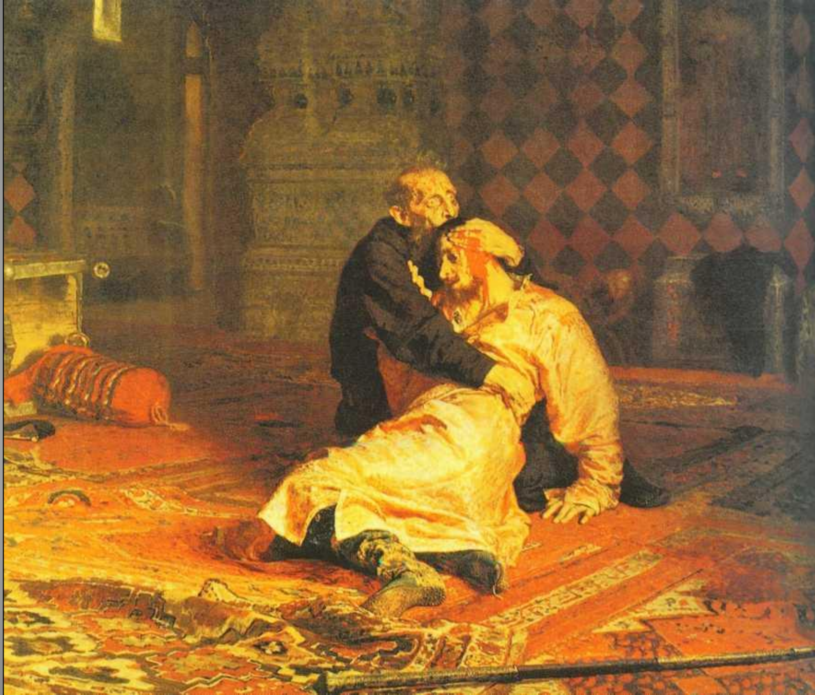
Иван Грозный убивает своего сына